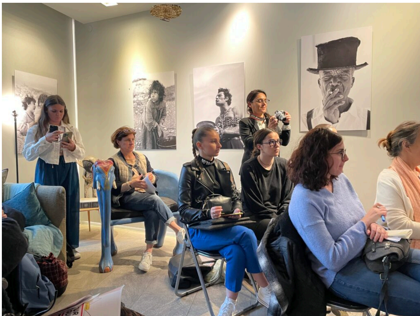
Au mur, les œuvres de l'immense photographe Hans Silvester