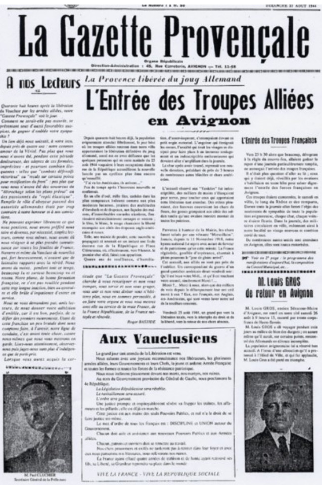
La ville d'Avignon sera libérée le 25 août par les troupes franco-américaines, ici devant la mairie de la cité des papes.