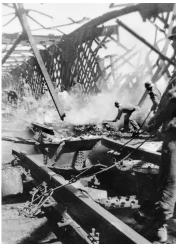
Les sapeurs de l'armée allemande interviennent sur le pont 'Eiffel' de chemin de fer entre Courtine et les Angles.