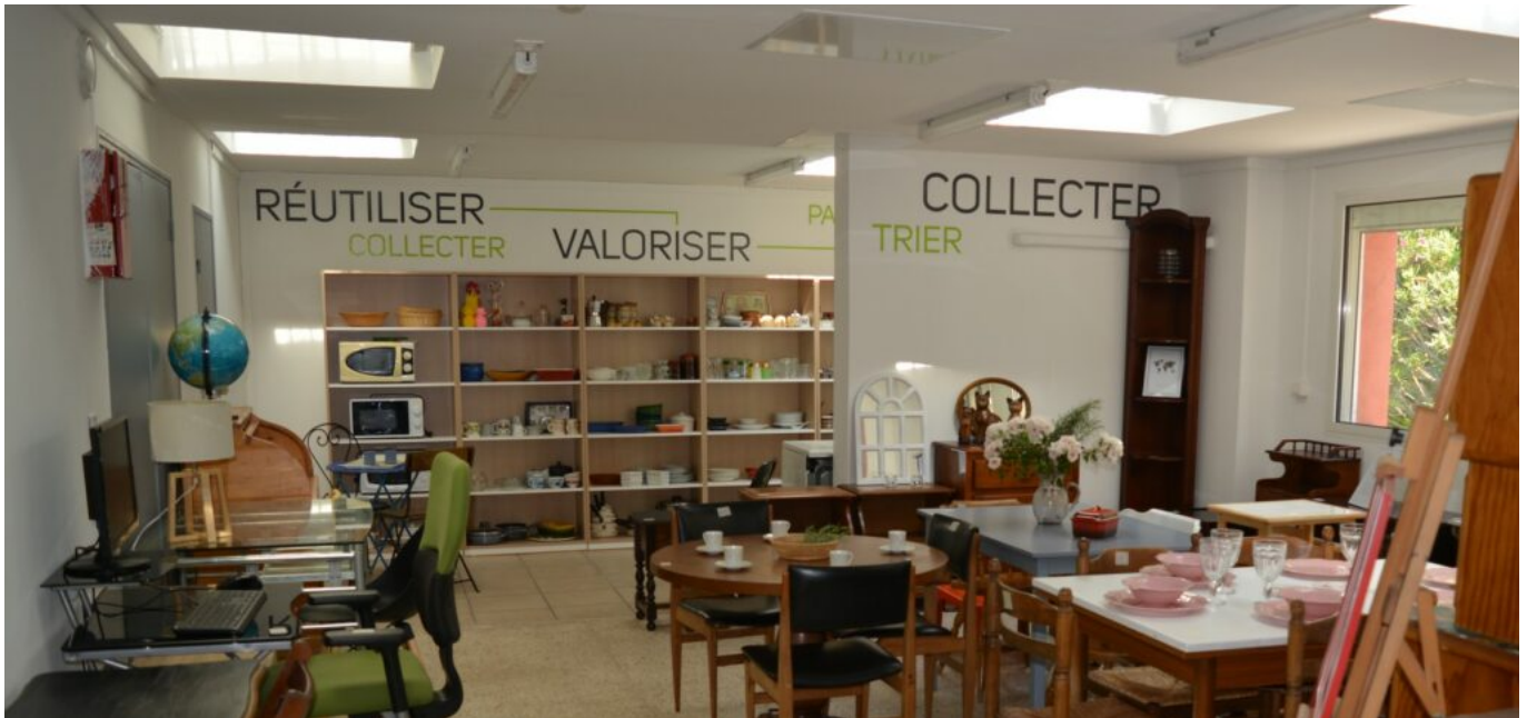
La recyclerie Delta Collect

cadre -comme le textile et les vélos- via des partenaires comme D3E, puis distribués auprès de locataires identifiés par les travailleurs sociaux et chargés de clientèle. Également, la distribution se fait sur rendez-vous les mercredi après-midi et samedi matin dans les locaux de Delta Collect'. Outre l'aspect social et solidaire, de valorisation, de partage et de protection de l'environnement, ce nouveau service s'inscrit dans la labellisation qualicoop (visibilité et diversité des pratiques coopératives) initiée par les Coop'Hlm.