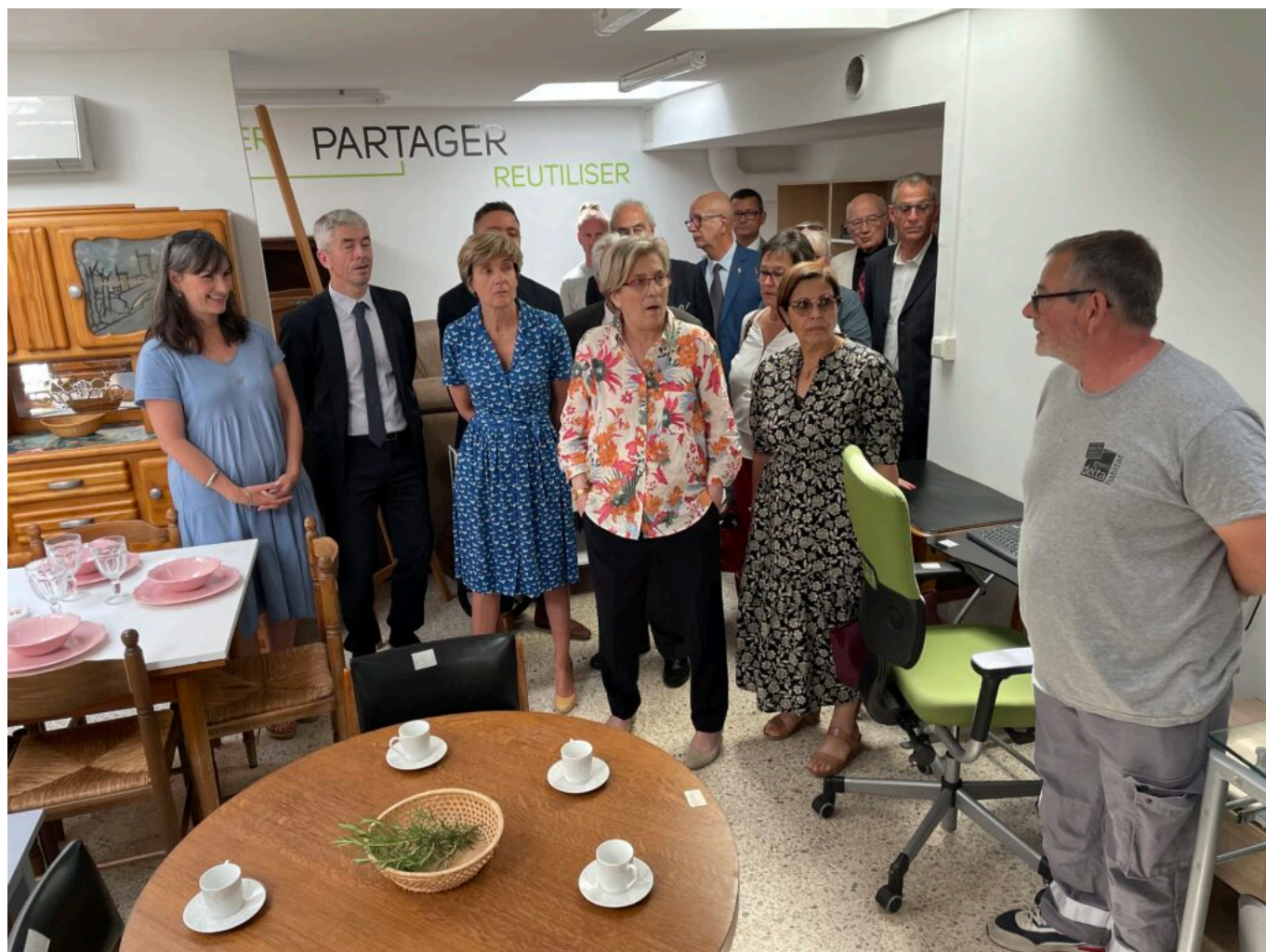
Visite de la recyclerie