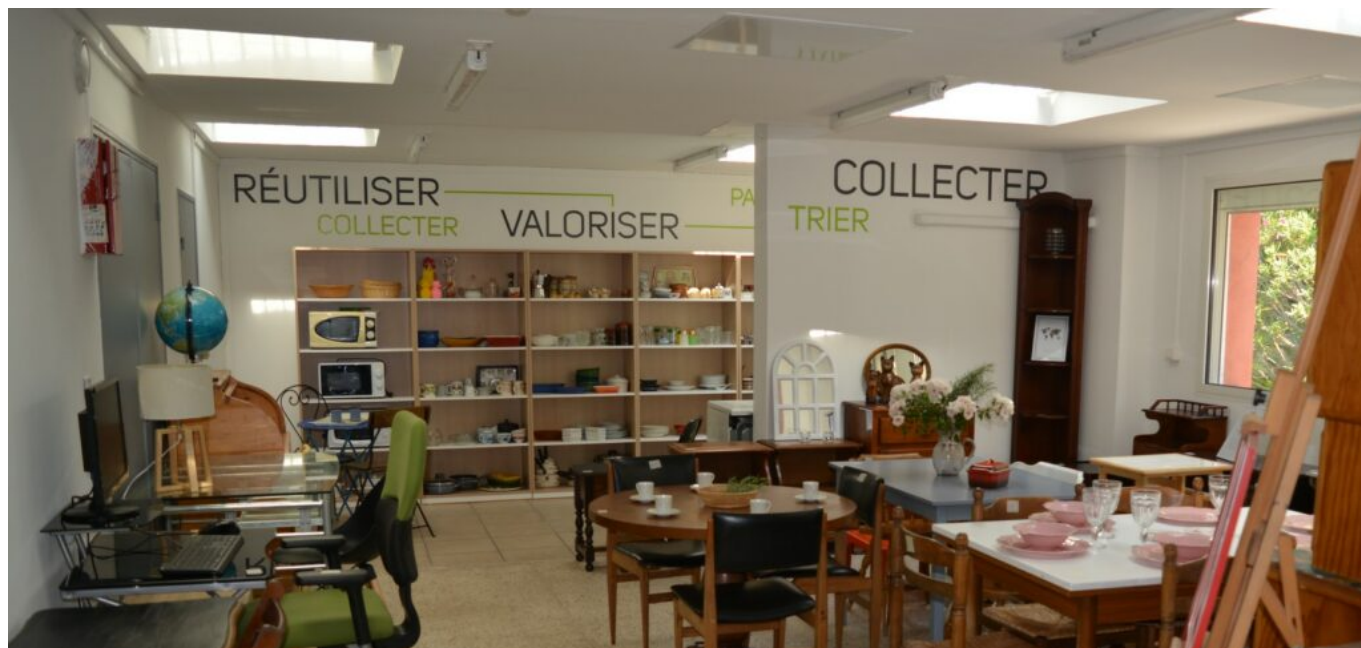
La recyclerie Delta Collect

cadre -comme le textile et les vélos- via des partenaires comme D3E, puis distribués auprès de locataires identifiés par les travailleurs sociaux et chargés de clientèle. Également, la distribution se fait sur rendez-vous les mercredi après-midi et samedi matin dans les locaux de Delta Collect'. Outre l'aspect social et solidaire, de valorisation, de partage et de protection de l'environnement, ce nouveau service s'inscrit dans la labellisation qualicoop (visibilité et diversité des pratiques coopératives) initiée par les Coop'Hlm.