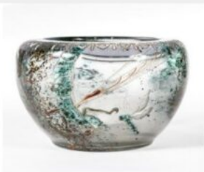
Emile GALLE (1846-1904) : * Les anisoptères * 1882. Rare et exceptionnelle coupe balustre évasée à large col annulaire rentrant. Epreuve en cristal soufflé au riche décor...