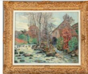
Armand GUILLAUMIN (1841-1927) : Moulin Charraut (dit Bouchardon). Huile sur toile signée en bas à droite, titrée sur le châssis et numérotée 21314. Dim. : 65,5x71 cm....