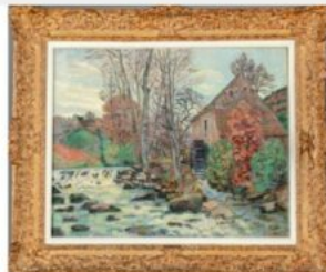
Armand GUILLAUMIN (1841-1927) : Moulin Charraut (dit Bouchardon). Huile sur toile signée en bas à droite, titrée sur le châssis et numérotée 21314. Dim. : 65,5x71 cm....