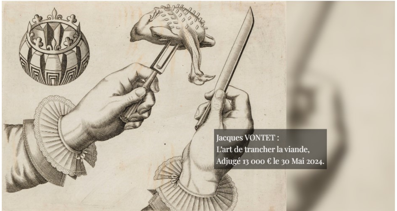
Jacques VONTET : L'art de trancher la viande, Adjugé 13 000 € le 30 Mai 2024.

Hôtel des ventes d'Avignon. 2, rue mère Teresa à Avignon. Fermé jusqu'à jeudi 29 août à 9h. Expertise sans rendez-vous tous les mardis de 9h à 12h et de 14h à 17h. Reprises aux horaires : du lundi au vendredi 10h-12h, 14h-17h. Mardi-jeudi : 9h-12h, 14h-18h. Mercredi 9h-12h. 04 90 86 35 35 contact@avignon-encheres.com