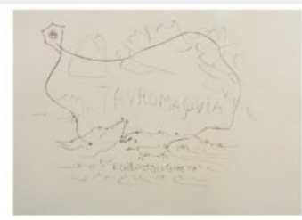
Pablo PICASSO (1881-1973): Jose DELGADO alias Pepe Illo - LA TAUROMAQUIA