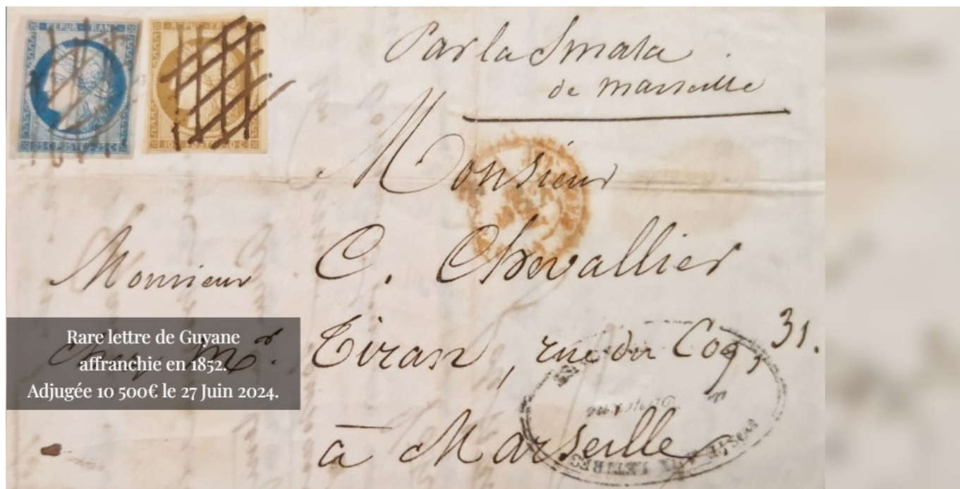
Rare lettre de Guyane affranchie en 1852. Adjudgée 10 500€ le 27 Juin 2024.