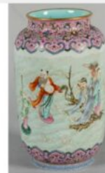
CHINE - XIXe siècle : Vase rouleau en porcelaine à décor émaillé