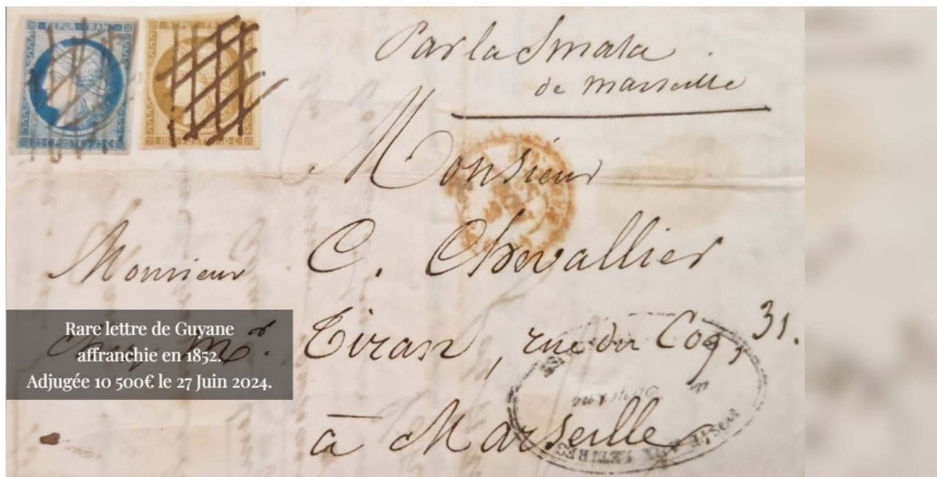
Rare lettre de Guyane affranchie en 1852. Adjudgée 10 500€ le 27 Juin 2024.