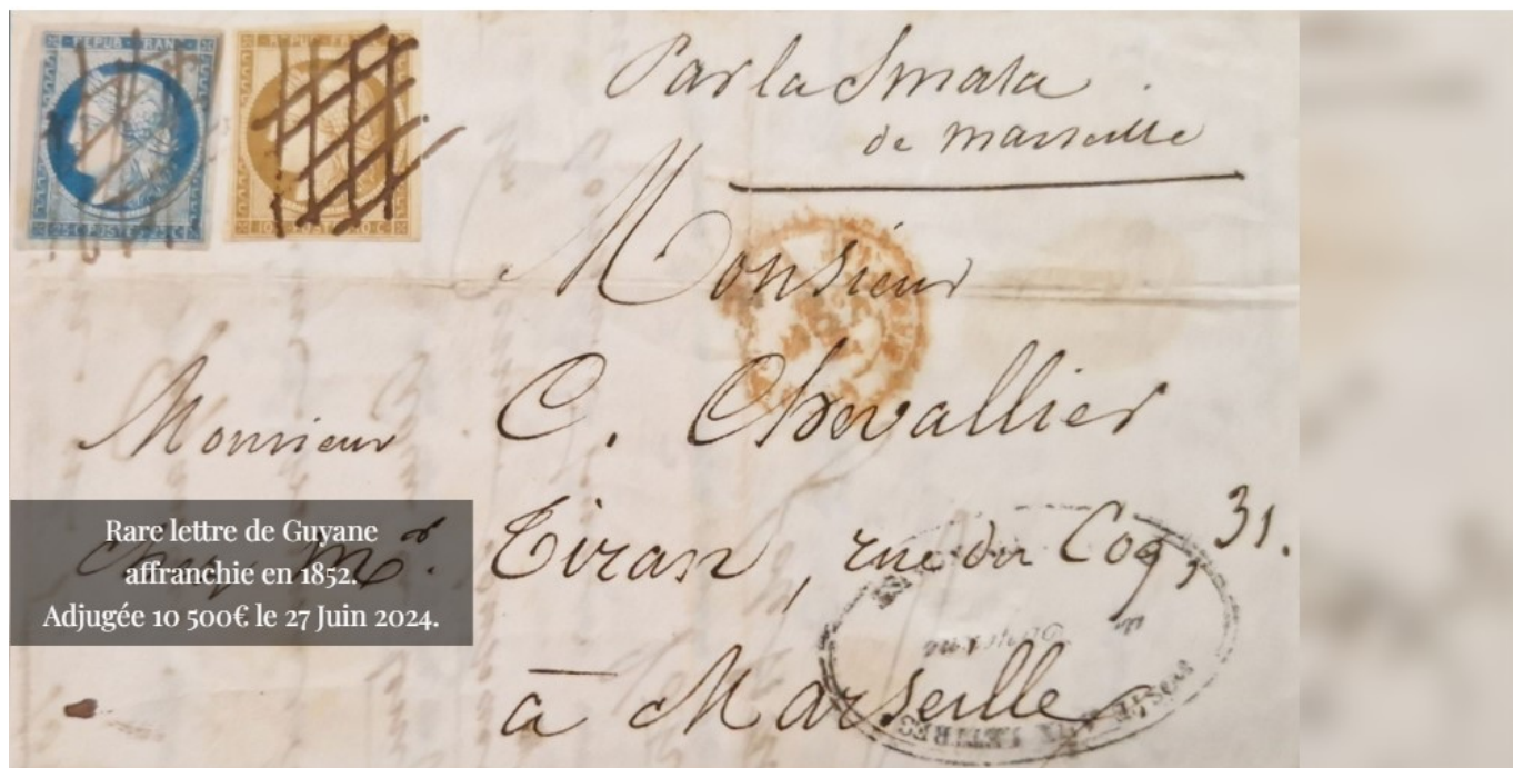
Rare lettre de Guyane affranchie en 1852. Adjugée 10 500€ le 27 Juin 2024.