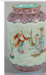
CHINE - XIXe siècle : Vase rouleau en porcelaine à décor émaillé