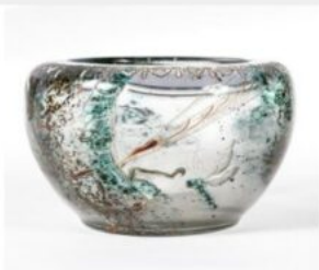
Emile GALLE (1846-1904) : " Les anisoptères " 1882. Rare et exceptionnelle coupe balustre évasée à large col annulaire rentrant. Epreuve en cristal soufflé au riche décor...