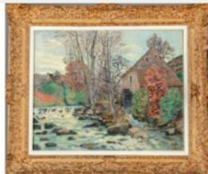
Armand GUILLAUMIN (1841-1927) : Moulin Charraut (dit Bouchardon). Huile sur toile signée en bas à droite, titrée sur le châssis et numérotée 21314. Dim. : 65,5x71 cm....