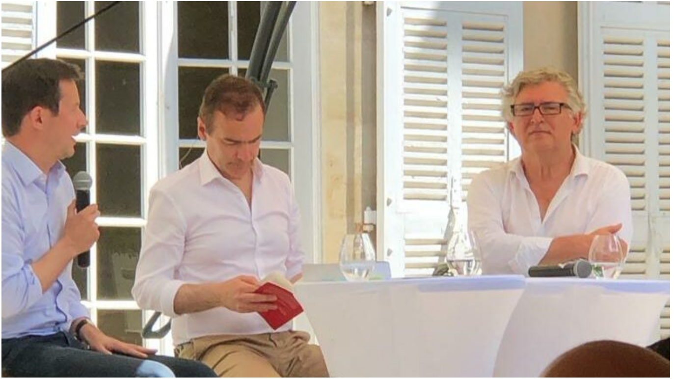
François-Xavier Bellamy, Franck Ferrand et Michel Onfray

Le temps long, la maturation, voilà des thèmes qui concernent aussi la politique. François-Xavier Bellamy est philosophe et député européen LR et il s'insurge contre le diktat de l'optimisme à tout prix. « Stop à la méthode coué. Il n'y a pas de lendemains qui chantent, j'ai horreur de l'optimisme béat, c'est une forme d'irresponsabilité face aux problèmes qui nous font face. Le pire slogan c'est celui de l'actuel locataire de l'Elysée « En marche », mais vers où, dans quel but, pour quoi faire? Marcher à tout prix, c'est ridicule. 'EM' ce sont les initiales du président on le sait, depuis il a changé le nom de son mouvement en 'Horizon'. C'est pareil, il se situe où? Là-bas...Au loin? »