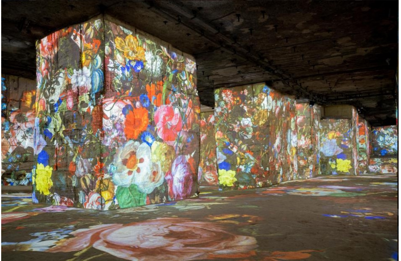
Flower power DR