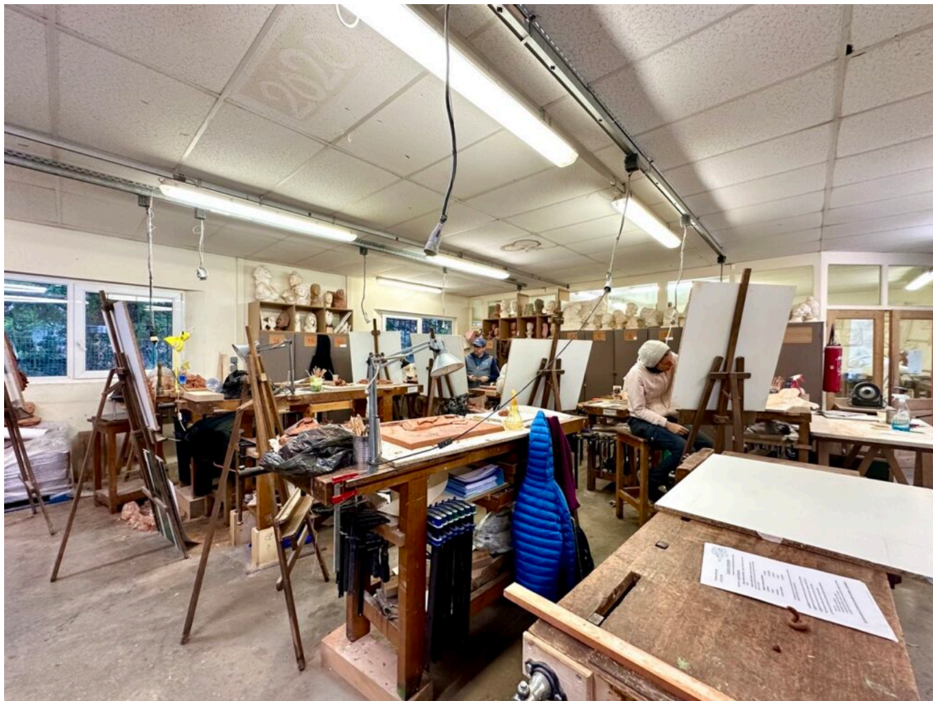
L'atelier de sculpture et dorure.