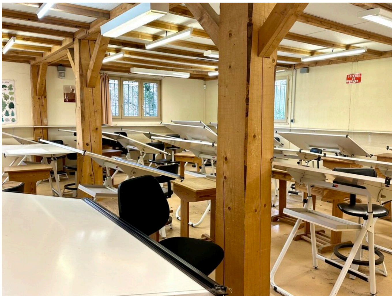
La salle de dessin.