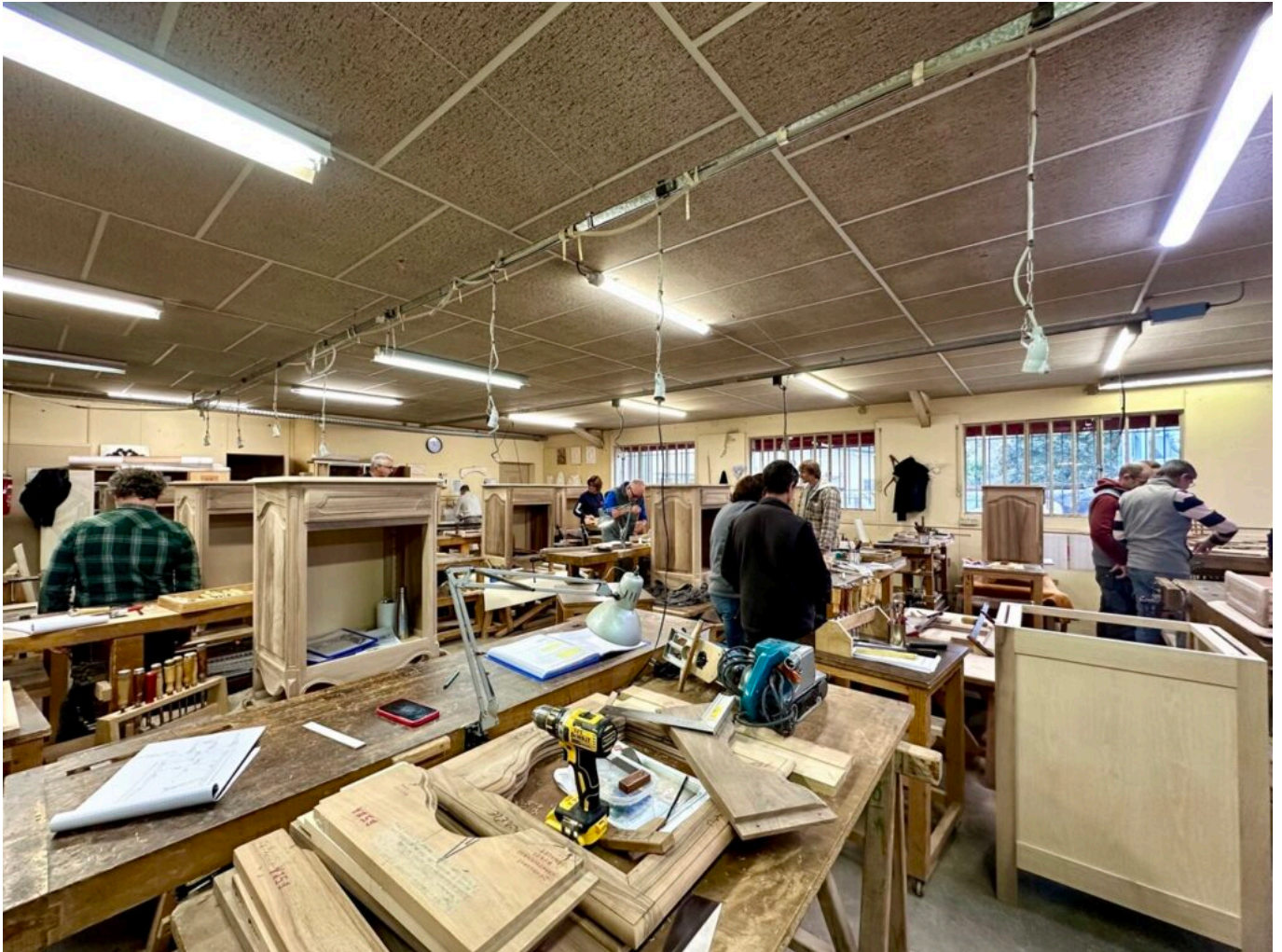
Un des deux ateliers d'ébénisterie.