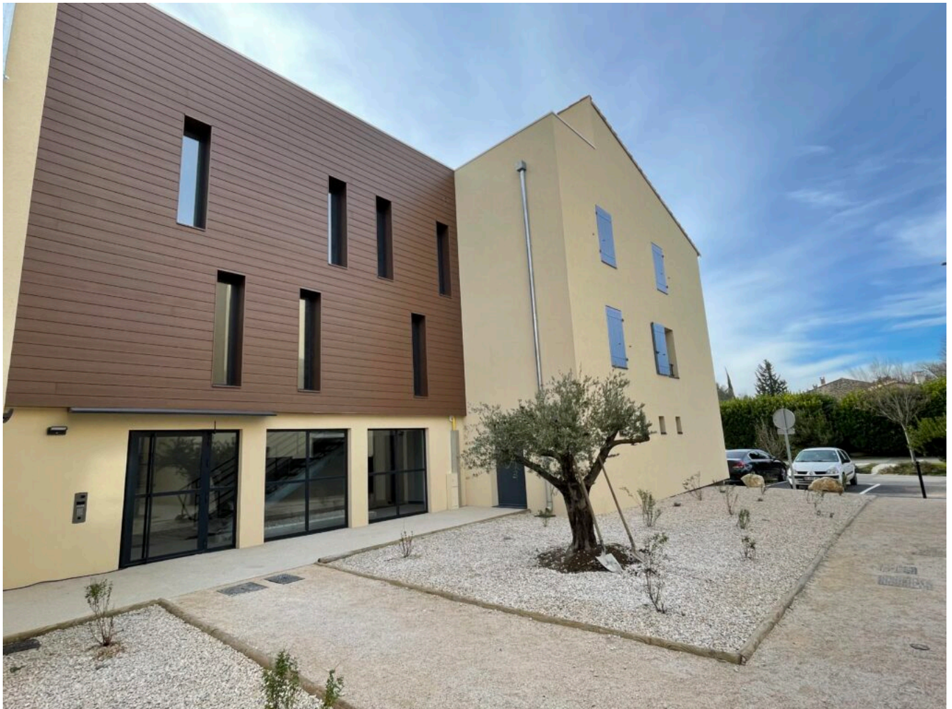
Les Glycines au Thor

C'est le cas de Grand Delta Habitat dans sa forme actuelle avec les défis à relever : la démolition de bâtiments datant des années 1970 qui ne sont plus adaptés à la vie actuelle, la réhabilitation, la construction et l'innovation. Le logement est un levier d'émancipation et de développement familiaux et de mixité sociale, ce qui participe à l'épanouissement de notre société.»