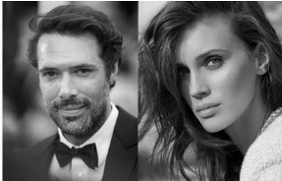
Nicolas Bedos (réalisateur) et Marine Vacth (actrice)

Synopsis : « Lorsqu'un jeune gigolo tombe sous le charme d'une sublime arnaqueuse, c'est le début d'un plan machiavélique sous le soleil brûlant de la Côte d'Azur. Les deux amoureux sont-ils prêts à tout pour s'offrir une vie de rêve, quitte à sacrifier celle d'une ancienne gloire du cinéma et d'un agent immobilier ? »