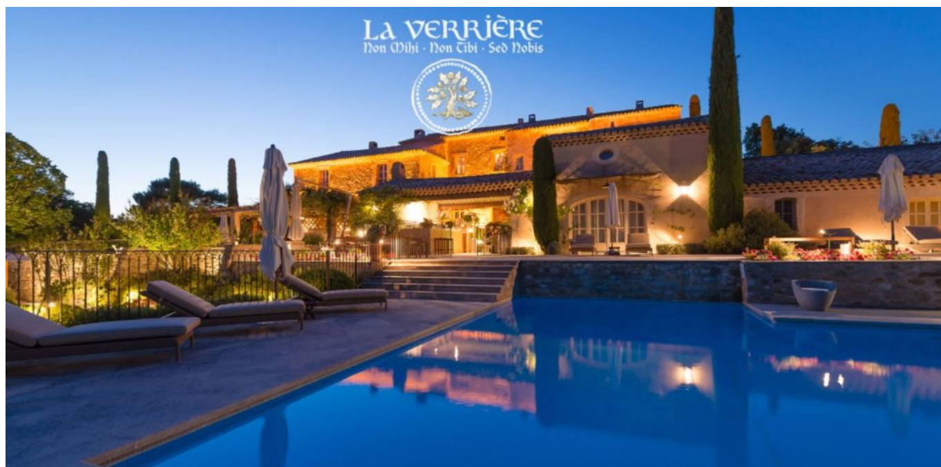
Le crépuscule des Dieux. @La Verrière

Sa posture de leader laisse une empreinte indélébile. Arrive la traditionnelle séance photo, il dirige, oriente la prise de vue. Mais il se résout très vite à adopter votre œil de photographe et vous laisse prendre la main. Ce qui vous marque ? Un verbe empreint de spiritualité et d'énergie positive. Le pont navigue entre les croyances ancrées du Moyen Âge, le taureau Vintur, Dieu du mal qui récolte les sacrifices humains (à l'origine du Mont Ventoux), la déesse Vaison et toute la symbolique de fertilité autour de la nature. Installé confortablement, son regard au loin se laisse transporter, animé d'une sagesse reconfortante. L'aura émanant de l'ancienne bastide du XVIII e est mystique.