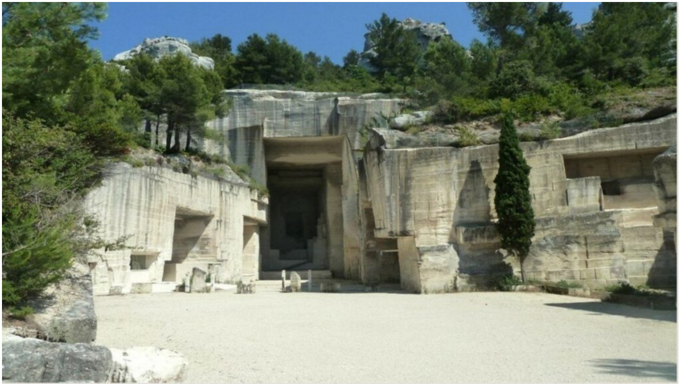
Entrée des Carrières de Lumières