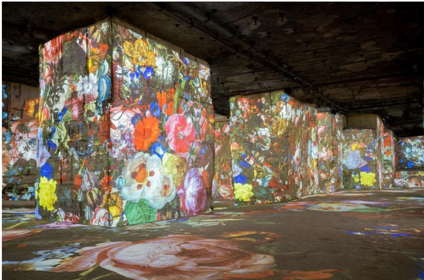
Flower power DR