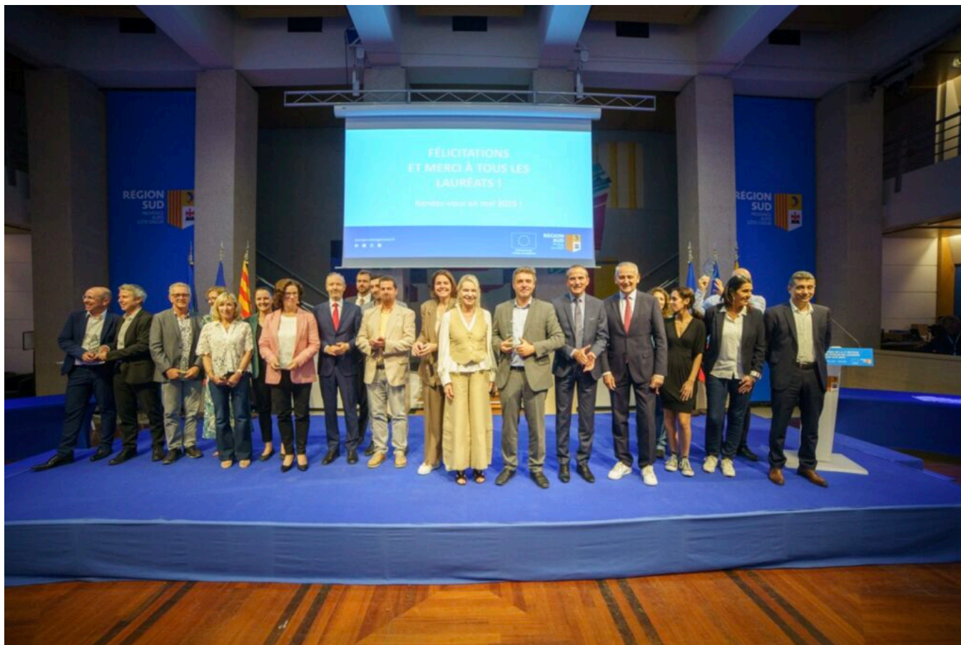
Les lauréats.

Parmi les lauréats cette année, on compte notamment l'exploitation Saint Félix, basée à Cavillon, qui est arrivée en haut du classement pour la catégorie 'Biodiversité'. Son projet, qui a aussi reçu le Prix spécial du jury, se base sur l'acquisition et l'installation de filets mono-rangs anti-insectes sur ses pommiers, afin de protéger les cultures sans avoir recours aux pesticides, tout en préservant la biodiversité. Le projet présente d'autres avantages tels que la réduction des traitements, de la consommation d'eau, des passages de tracteurs et donc leurs émissions de gaz à effet de serre.