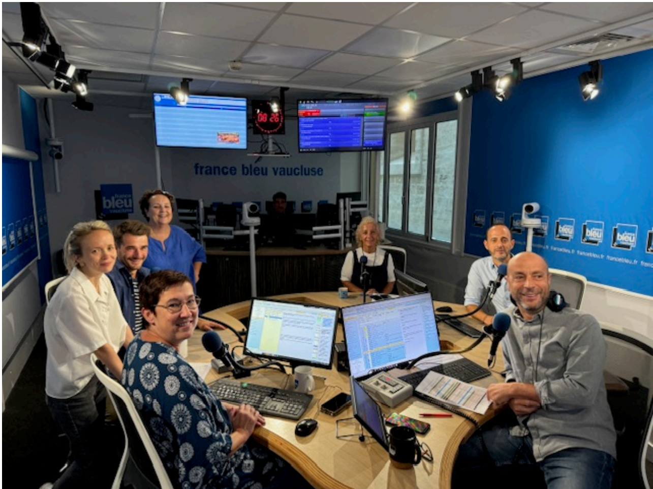
L'équipe des matinales de France bleu Vaucluse.