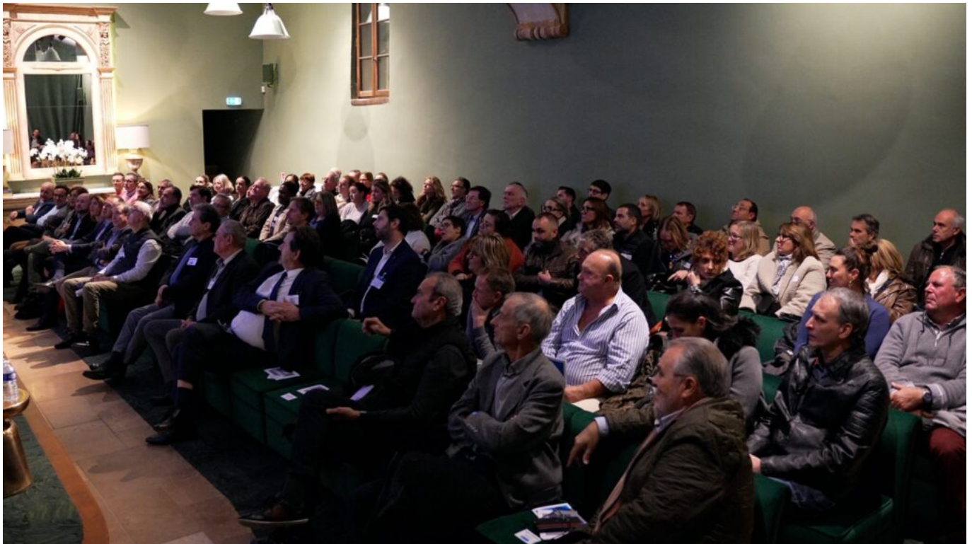
Salle comble pour la 1 re Nuit de commerce de proximité.