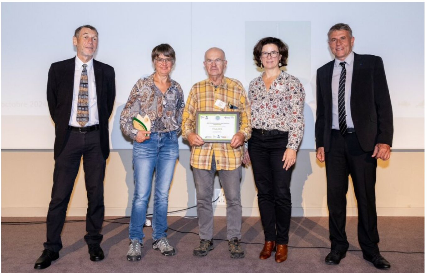
La commune de Villars devient un 'Territoires engagés pour la nature'.

De son côté, Villars a séduit par sa volonté de sensibiliser les élus aux enjeux de préservation de la biodiversité par l'organisation de visites et de formations, de communiquer sur la richesse et la fragilité de la forêt communale par la pose de panneaux d'information, d'intégrer la réflexion de l'intensité lumineuse pour préserver la faune dans le projet de remplacement des luminaires de la commune ainsi que de réaliser un inventaire de la biodiversité communale.