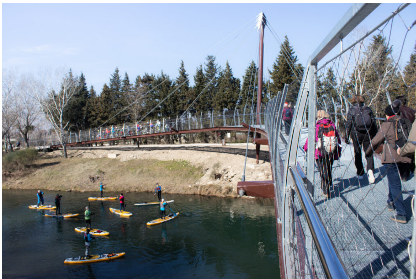
La passerelle himalayenne de Sorgues enjambant l'Ouvèze

La passerelle contribue à promouvoir les modes doux de déplacement, une nouvelle liaison entre certains quartiers isolés du centre-ville de Sorgues et de l'Ouvèze qui joue un rôle de frontière naturelle. Elle a également pour objet de développer l'attractivité du centre-ville et de redynamiser le commerce, de booster l'attractivité touristique, notamment via la fréquentation de la voie Rhône, et, surtout, d'accroître, au quotidien, la qualité de vie des habitants et visiteurs.