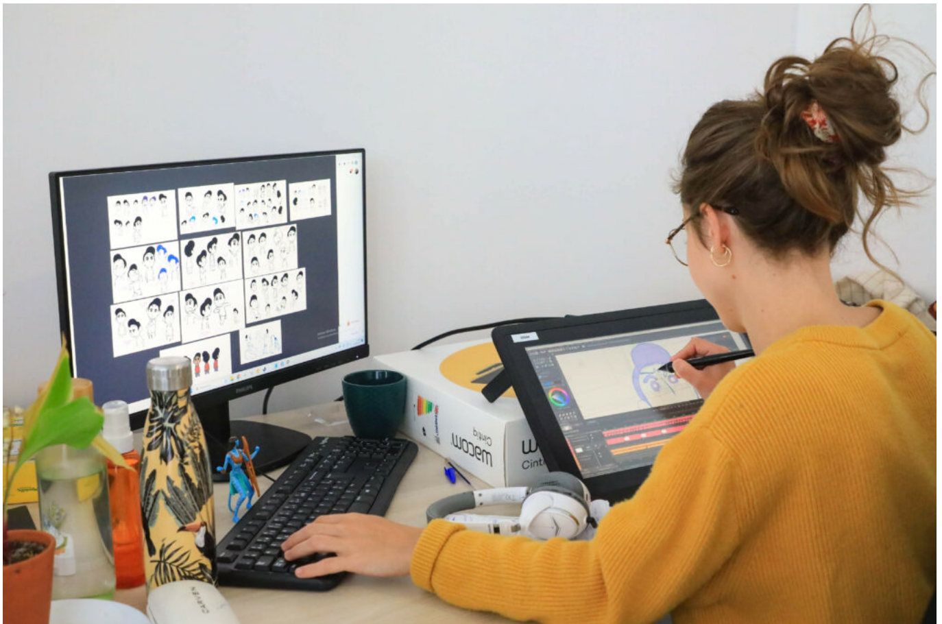
Les artistes réalisent la mise en mouvement des personnages

Avec cette installation, l'objectif des deux créateurs et de leur équipe, composée d'une quinzaine de personnes, est de produire leurs propres films, séries, courts et longs-métrages. Pour l'instant, le studio finalise son premier projet qui consiste à assurer une partie de l'animation du « Collège noir ». Composée de six épisodes de 15 minutes, la diffusion de cette série, adaptée de la BD éponyme d'Ulysse Malassagne, est prévue pour octobre sur la plateforme de streaming ADN , puis sur Slash (France Télévision).