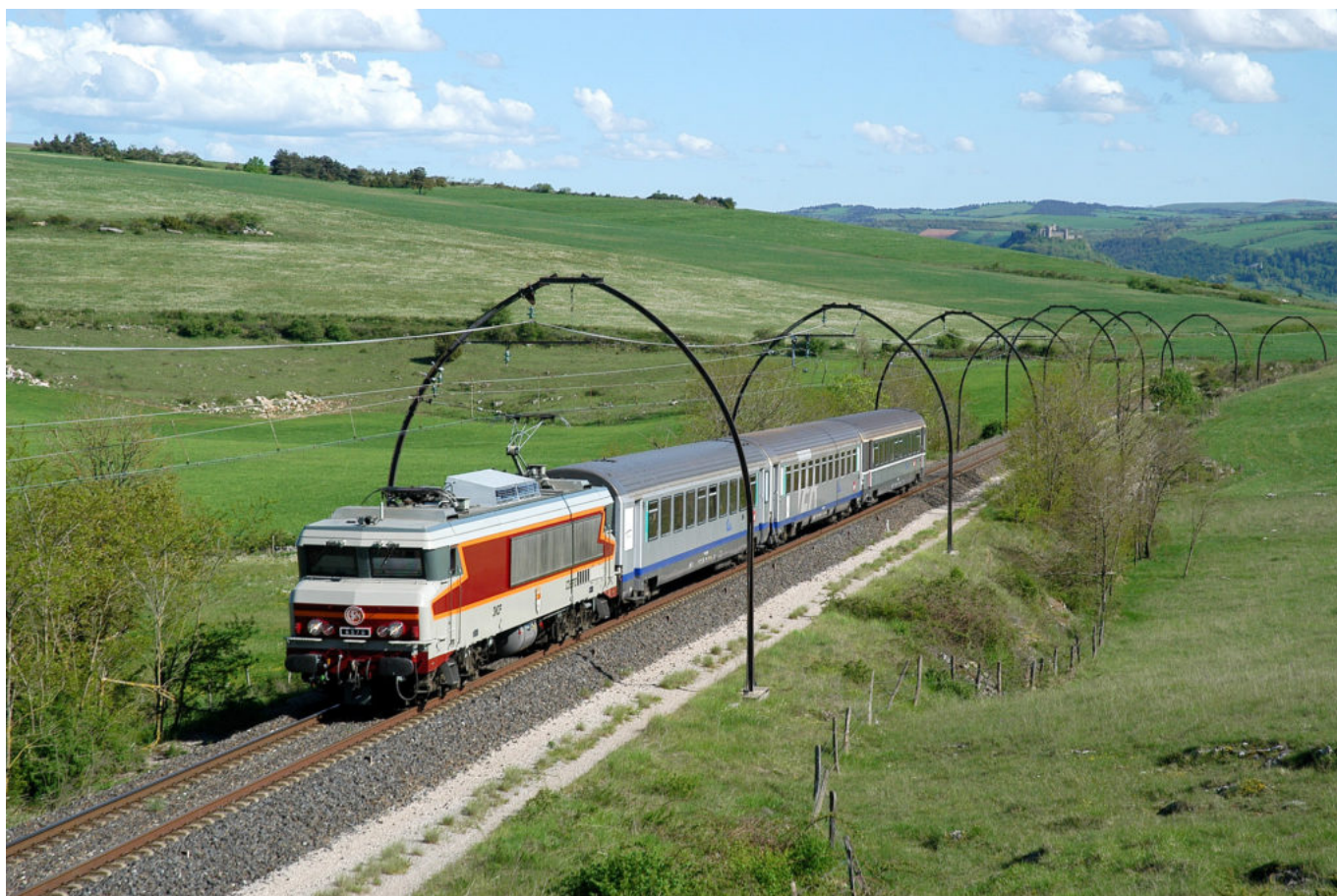
la CC6570