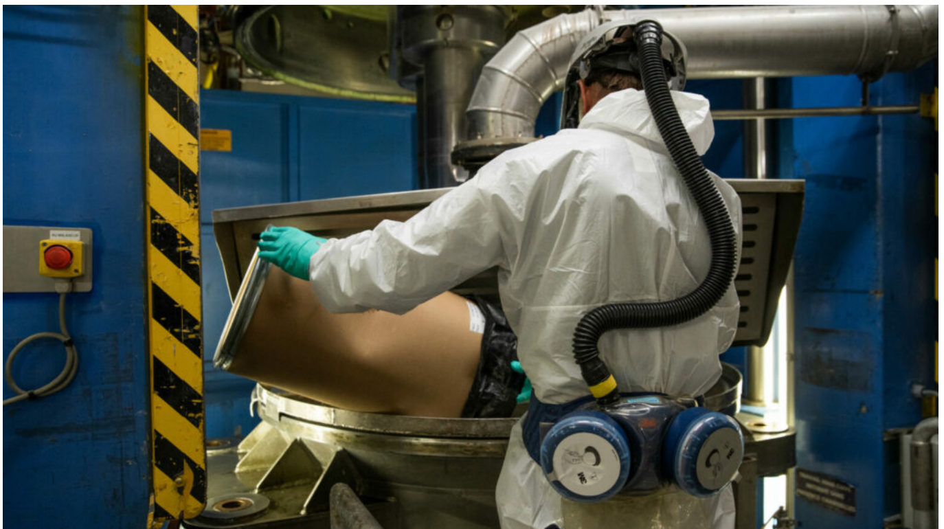
Le site de production de Sorgues du leader européen des poudres et explosifs.

Installée aussi à Bergerac, en Belgique et en Suède, Eurenco emploie plus de 1 200 personnes pour un chiffre d'affaires en hausse de +30% en 2022 et espère atteindre 600M€ d'ici 2025.