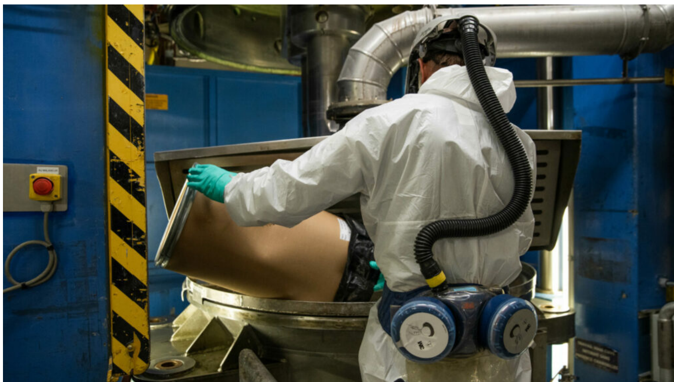
Le site de production de Sorgues du leader européen des poudres et explosifs.

Installée aussi à Bergerac, en Belgique et en Suède, Eurenco emploie plus de 1 200 personnes pour un chiffre d'affaires en hausse de +30% en 2022 et espère atteindre 600M€ d'ici 2025.