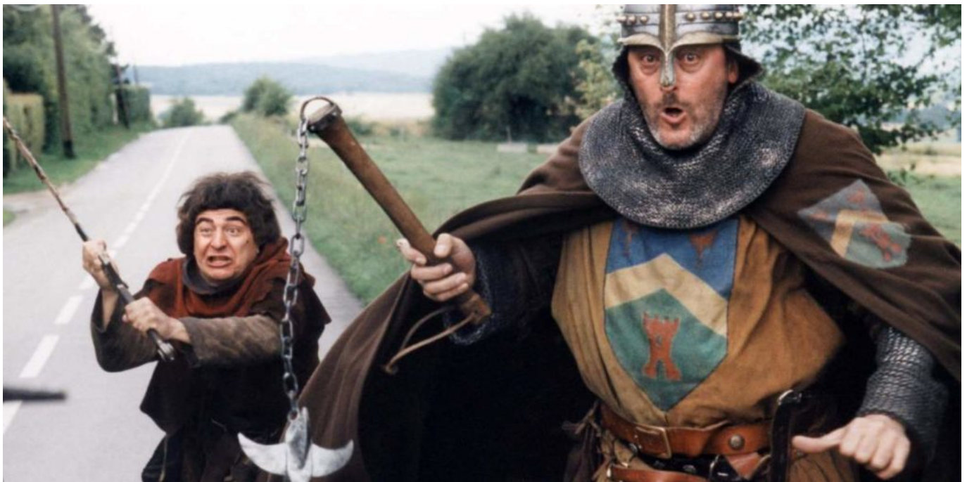
Christian Clavier et Jean Reno, ‘Les visiteurs’.