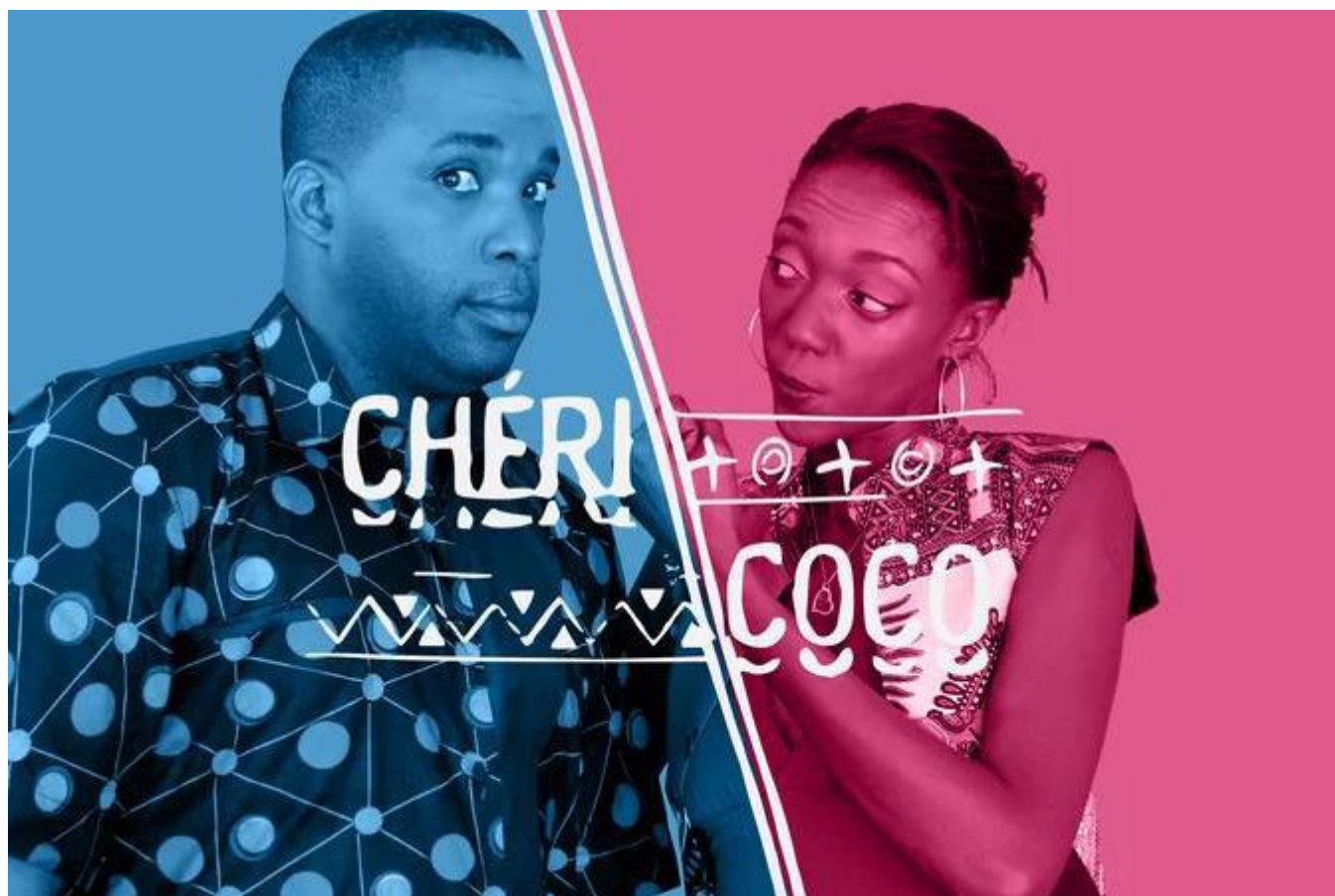
Série 'Chérie coco'.

Le succès est immédiat et populaire. Eu égard à la différence de culture, le pari était pourtant audacieux, « c'était délicat de montrer un couple dans son intimité, qui parle librement de tout. C'est rarement un programme que tout le monde regarde en famille ». Le deal ? Sortir de Dakar, montrer l'Afrique, la brousse, la réserve naturelle, la plage. Après deux saisons et 200 épisodes, le programme prend fin pour des raisons financières. Le souvenir, lui, demeure éternel.