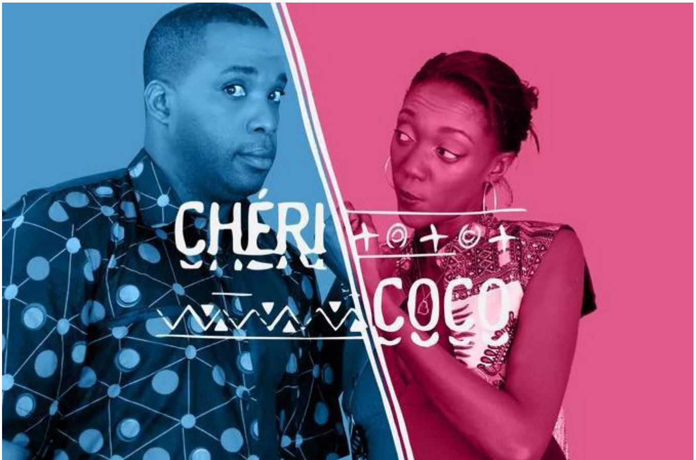
Série 'Chérie coco'.

Le succès est immédiat et populaire. Eu égard à la différence de culture, le pari était pourtant audacieux, « c'était délicat de montrer un couple dans son intimité, qui parle librement de tout. C'est rarement un programme que tout le monde regarde en famille ». Le deal ? Sortir de Dakar, montrer l'Afrique, la brousse, la réserve naturelle, la plage. Après deux saisons et 200 épisodes, le programme prend fin pour des raisons financières. Le souvenir, lui, demeure éternel.