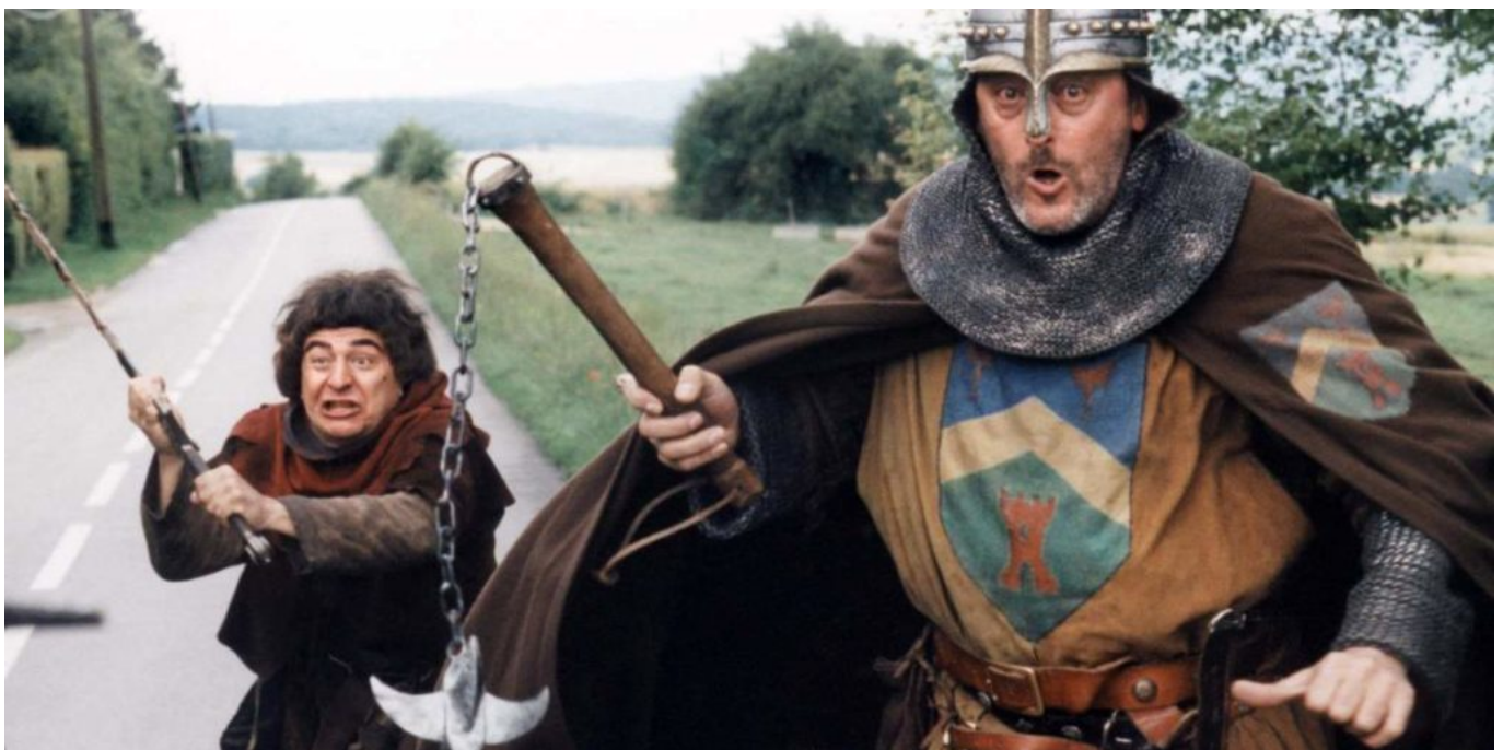
Christian Clavier et Jean Reno, ‘Les visiteurs’.