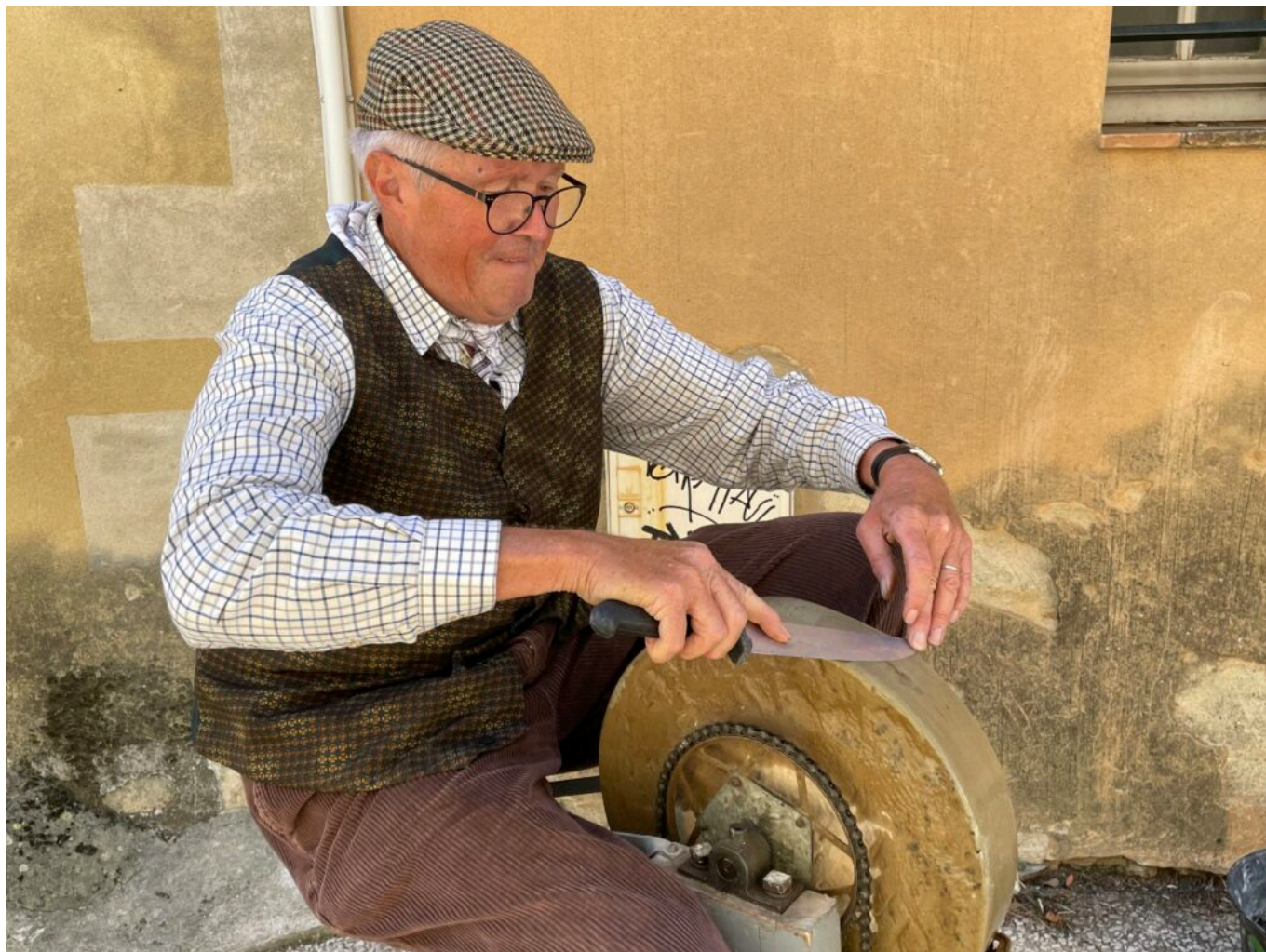
Le Rémouleur