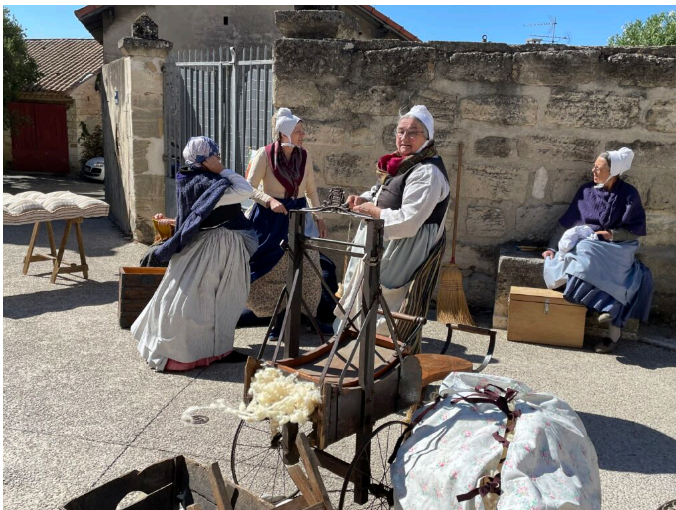
Cardage de la laine, fabrication de matelas

13h30, ouverture des journées du patrimoine dans le jardin de l'église, 12h-14h30 Restaurant dans le jardin de l'église, 13h30-18h Jeux en bois avec l'association Oser, place de l'église 13h45-16h Orgue de barbarie avec Francis Cauli de Surunfil dans les rues et les calades du vieux village, 14h30-16h30 Cuisson des pains et des brioches du Petit gourmand, dans le four banal et vente des produits, sur place, rue de la République, 15h-16h30 Balade commentée du village, départ depuis la Tour des Mascos, 15h-17h Dessin d'après nature, initiation gratuite avec Serge Le Cun, dans les rues et les calades du vieux village, 16h-17h, Francis Cauli raconte des histoires aux enfants au jardin du presbytère, 17h30-18h30 Théâtre Le lavoir, œuvre de Dominique Durvin et Hélène Prévost sur une libre adaptation de Bertrand Beillot, au lavoir.