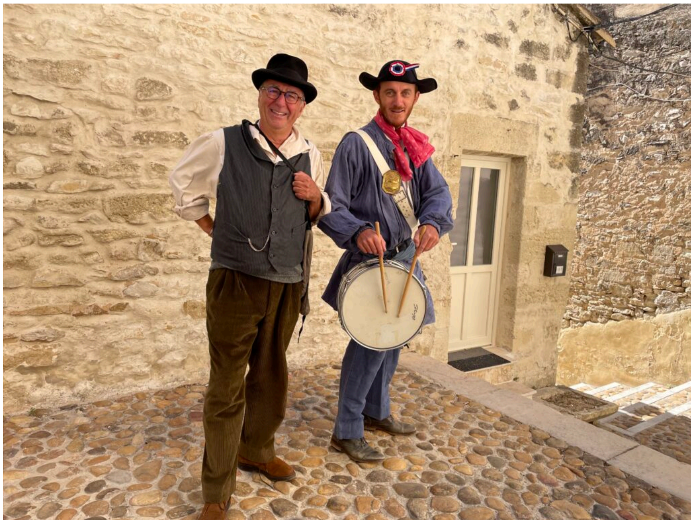
Un Anglois du siècle dernier et le garde-champêtre du village

journée ordinaire du début du 20 e siècle qui finira par bouleverser le monde entier. Car personne ne se doute que cette journée va faire basculer leur destin avec la déclaration de ce que l'on nommera, plus tard, la Grande Guerre. Quatre beaux portraits de femmes, servis par un texte vif et poétique, un vrai régal pour les comédiennes comme pour les spectateurs. La mise en scène est de Bertrand Beillot et le régisseur est Christian Rollot.