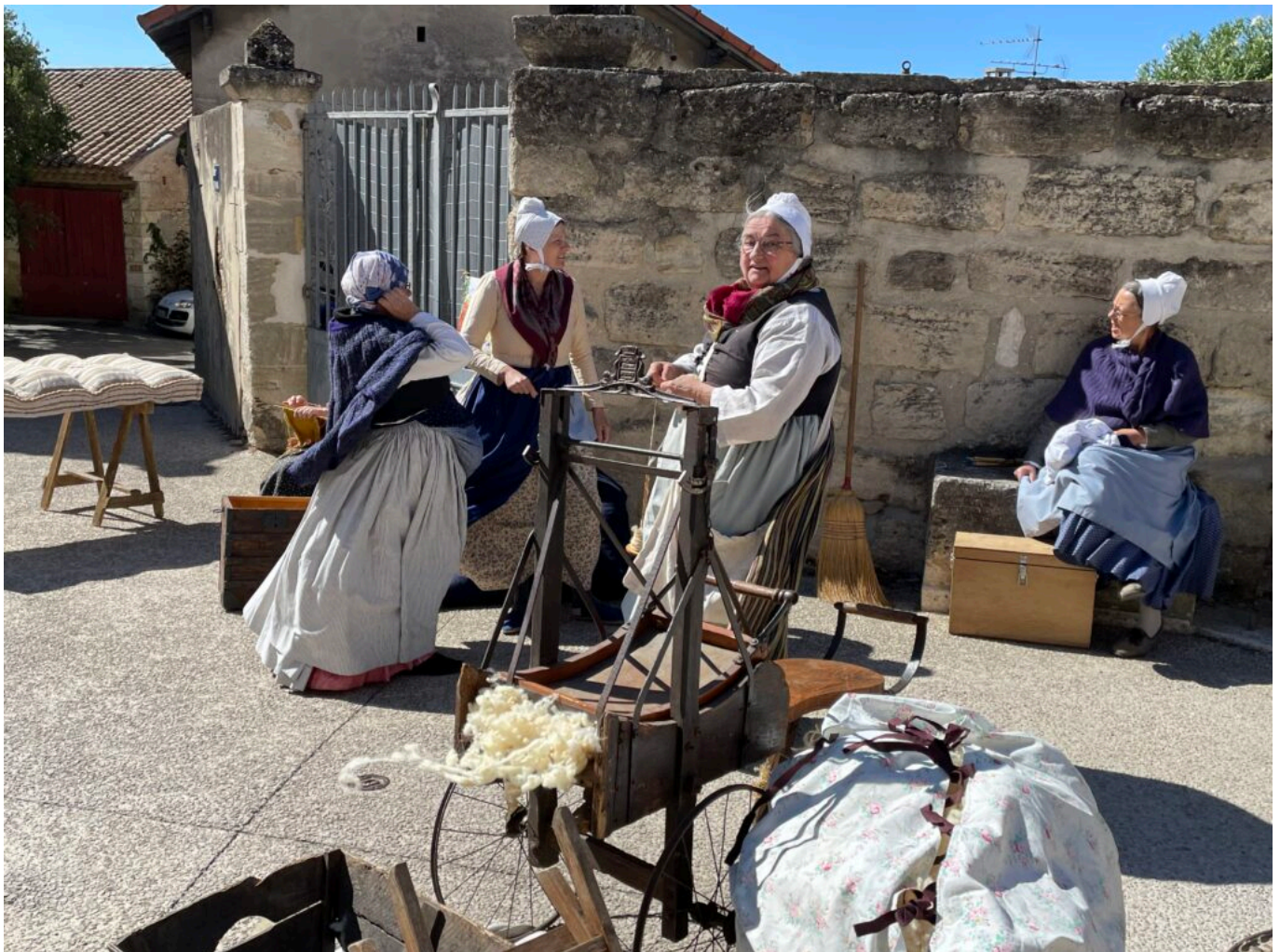
Cardage de la laine, fabrication de matelas

13h30, ouverture des journées du patrimoine dans le jardin de l'église, 12h-14h30 Restaurant dans le jardin de l'église, 13h30-18h Jeux en bois avec l'association Oser, place de l'église 13h45-16h Orgue de barbarie avec Francis Cauli de Surunfil dans les rues et les calades du vieux village, 14h30-16h30 Cuisson des pains et des brioches du Petit gourmand, dans le four banal et vente des produits, sur place, rue de la République, 15h-16h30 Balade commentée du village, départ depuis la Tour des Mascos, 15h-17h Dessin d'après nature, initiation gratuite avec Serge Le Cun, dans les rues et les calades du vieux village, 16h-17h, Francis Cauli raconte des histoires aux enfants au jardin du presbytère, 17h30-18h30 Théâtre Le lavoir, œuvre de Dominique Durvin et Hélène Prévost sur une libre adaptation de Bertrand Beillot, au lavoir.