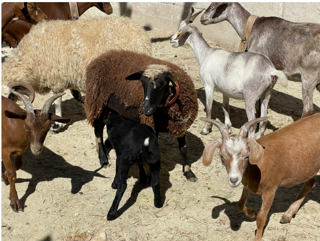
Troupeau d'ovins

Les visiteurs seront invités à entrer dans l'église et à faire le parcours des croix, à l'église Notre Dame de l'Assomption, hors offices et cérémonies. Les bergers avec leurs moutons, âne, chèvres et chien chemineront dans les rues et les calades. Il sera tout aussi possible de profiter de ces dernières belles journées de l'été pour découvrir les sentiers des plantes, des peintres et le patrimoine bâti.