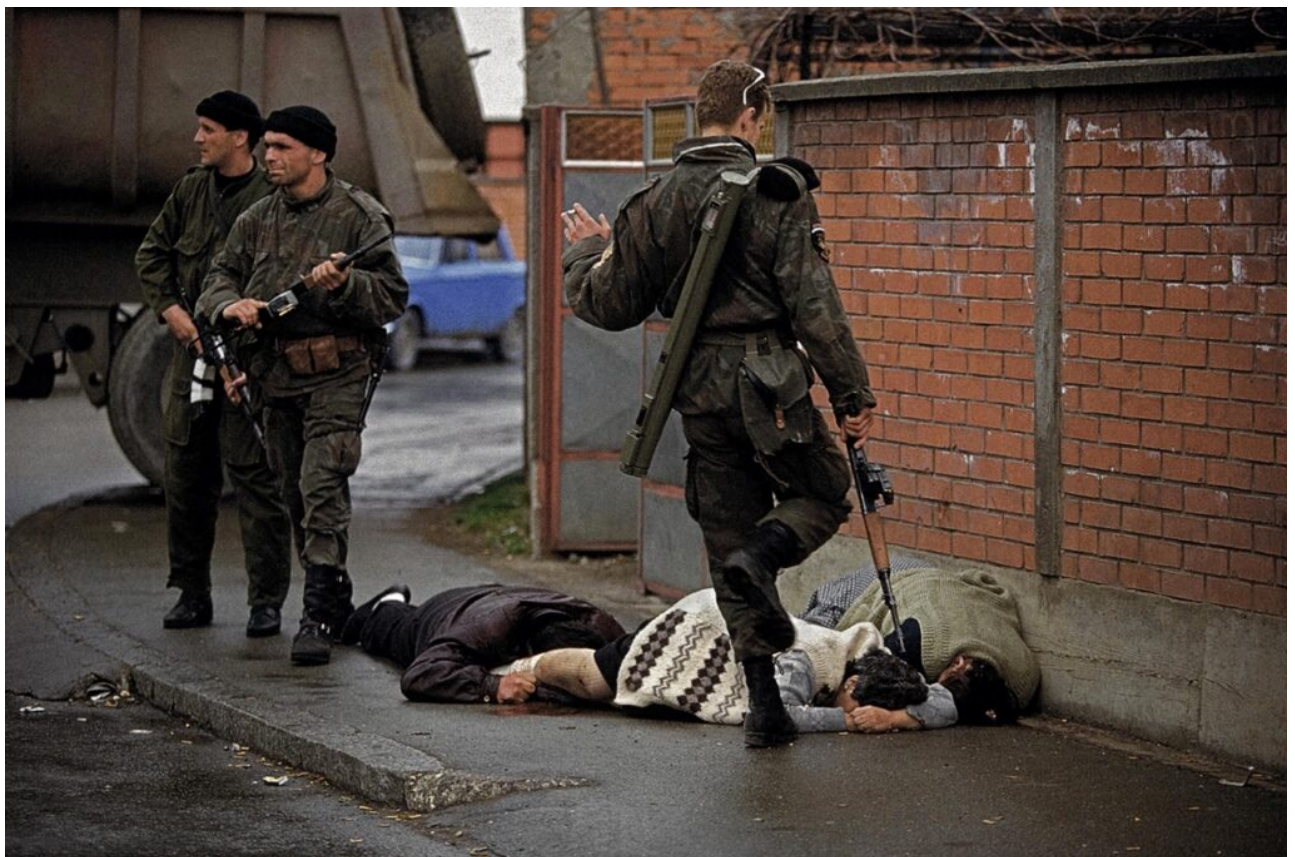
(Bosnie, avril 1992)