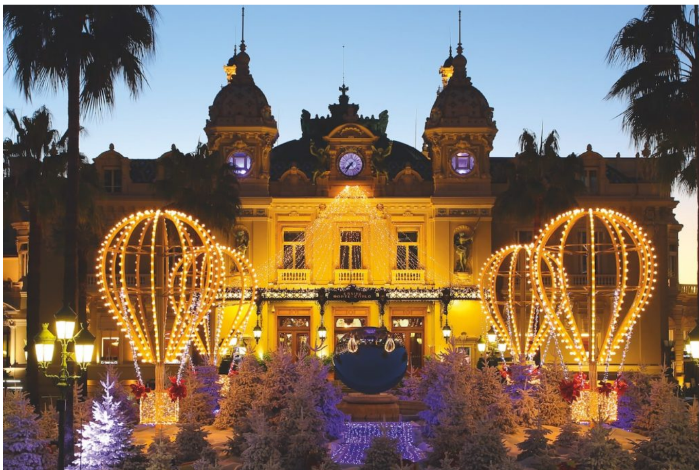
Blachère illuminations à Monaco.