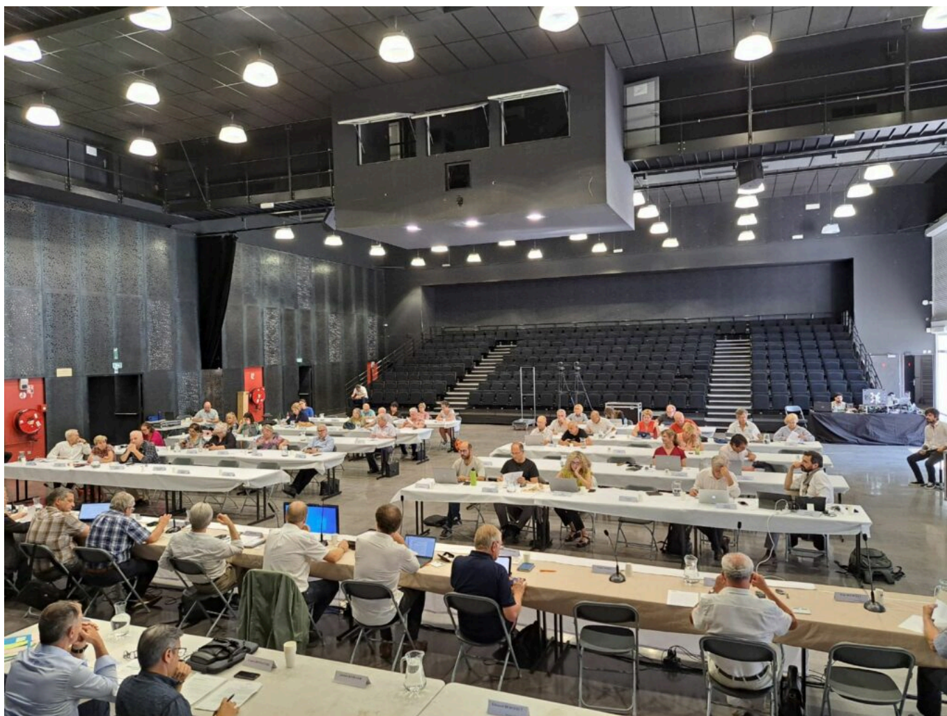
Les élus communautaires lors de la séance plénière du lundi 26 juin 2023.

Suit un power-point sur ce compte administratif avec d'abord les recettes : 366M€, en augmentation de + 4,1% alors qu'en 2019-2021 (COVID), elle n'était que de 1,1%. Côté dépenses : 343M€. Ce qui contribue à un désendettement de 23M€ avec un auto-financement brut qui se maintient à plus de 39M€.