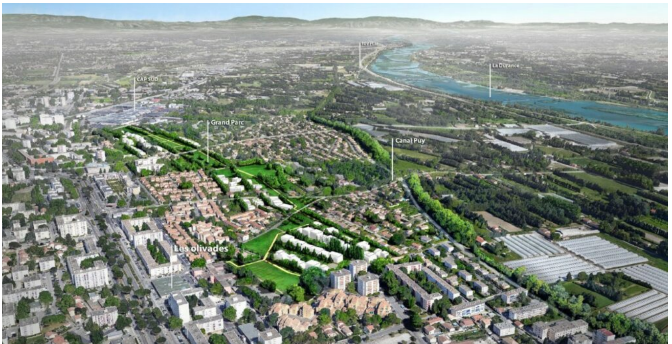
L'éco-quartier de Joly-Jean.