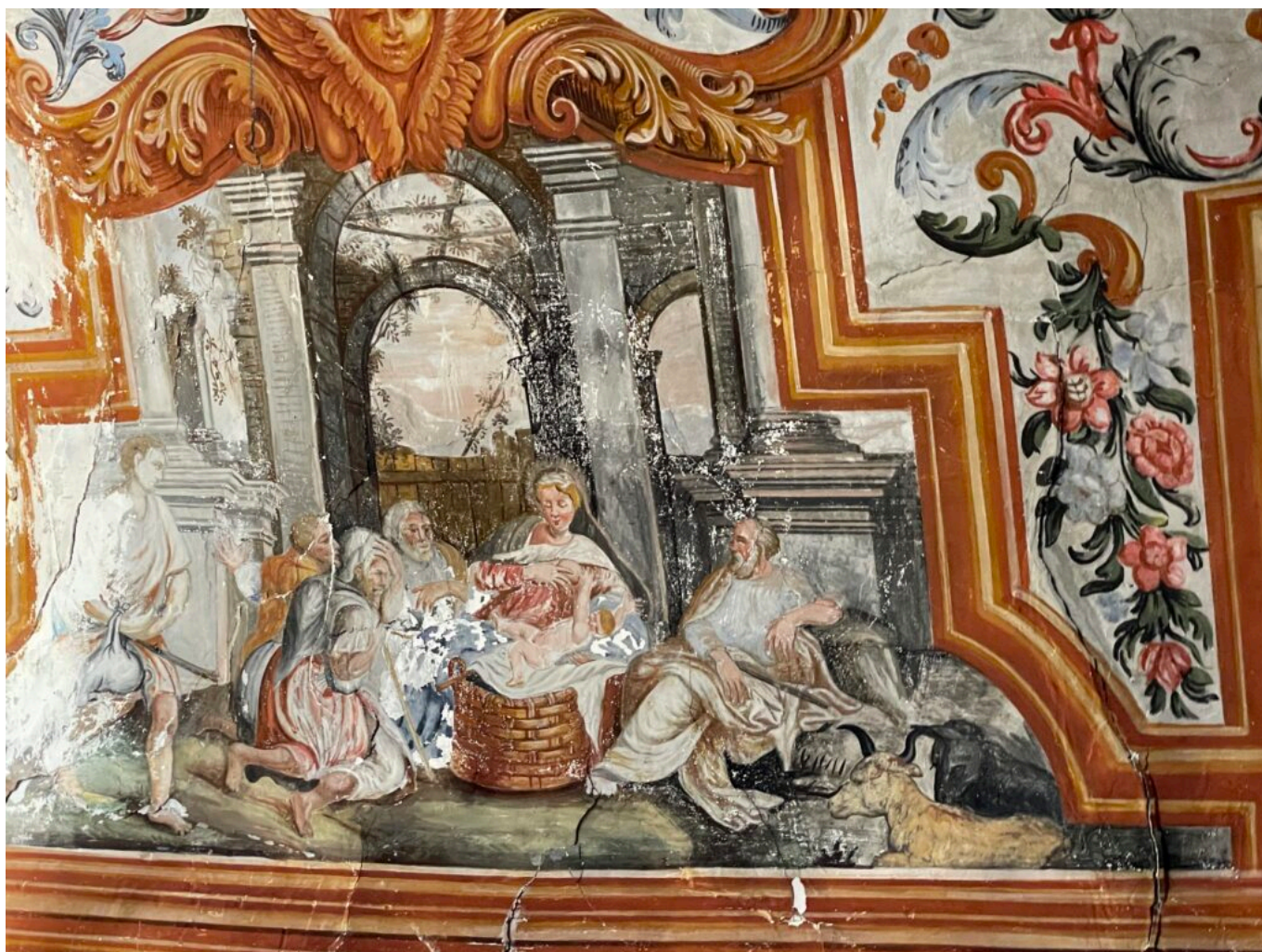
Détail d'une fresque de la chapelle Notre dame la Brune