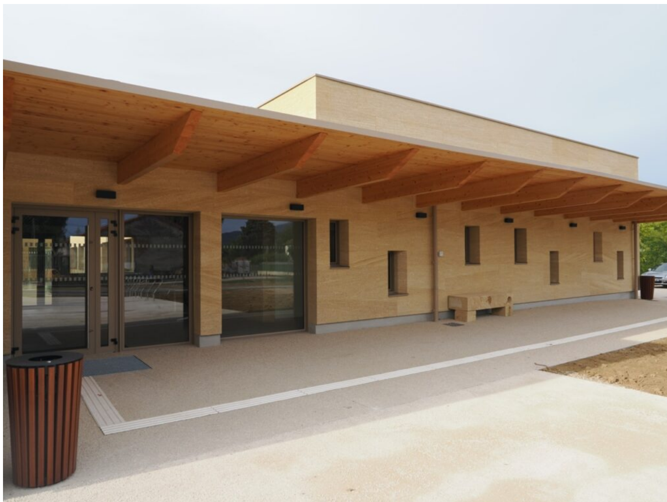
La salle Sandrine Martinet

La salle Sandrine Martinet sera inaugurée le samedi 12 octobre à 18h en présence de la championne paralympique.