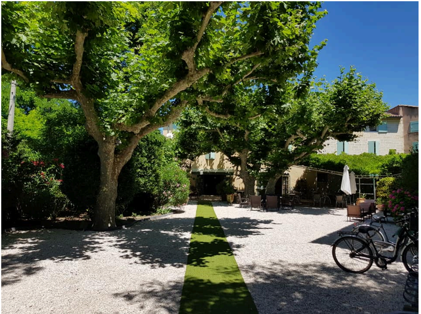
Photo: hôtel restaurant 3 étoiles 'La ferme'