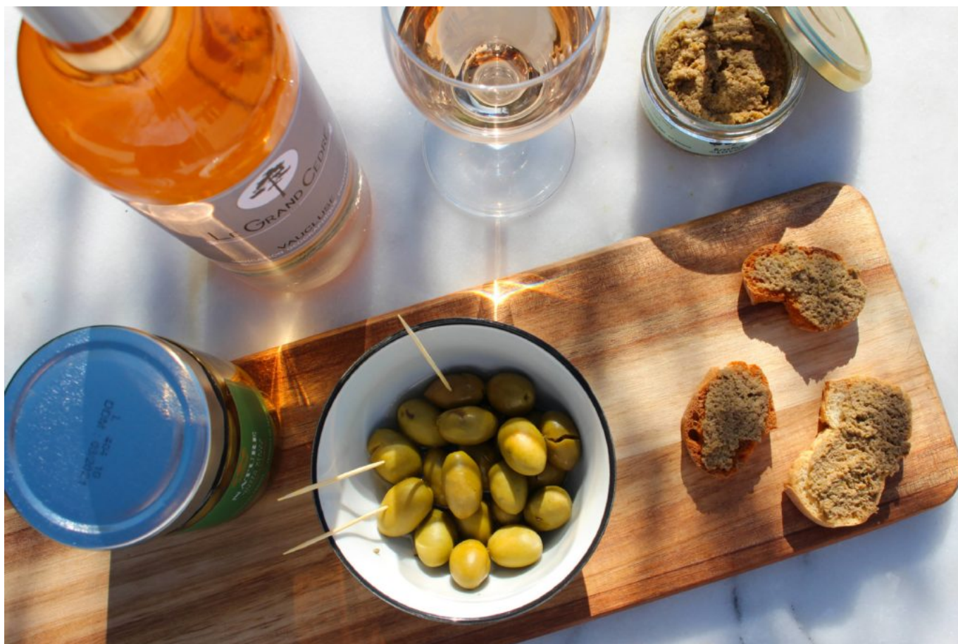
Piquez dans l'assiette.