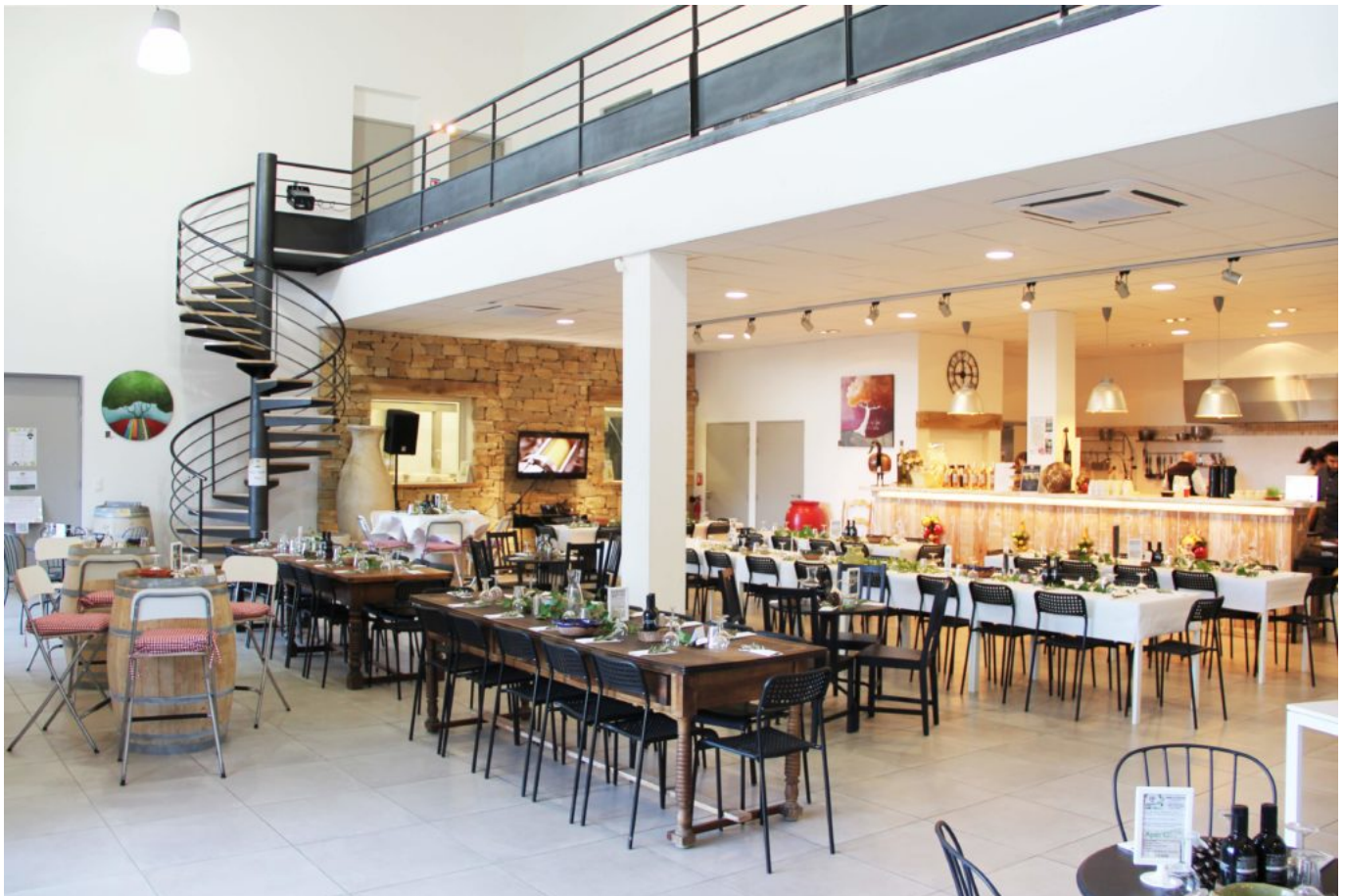
Plus qu'un simple moulin...

Le ou la gagnant(e) sera désigné(e) au sort le lundi 9 août 2021 ! Réception du coffret au sein de la rédaction à Avignon.