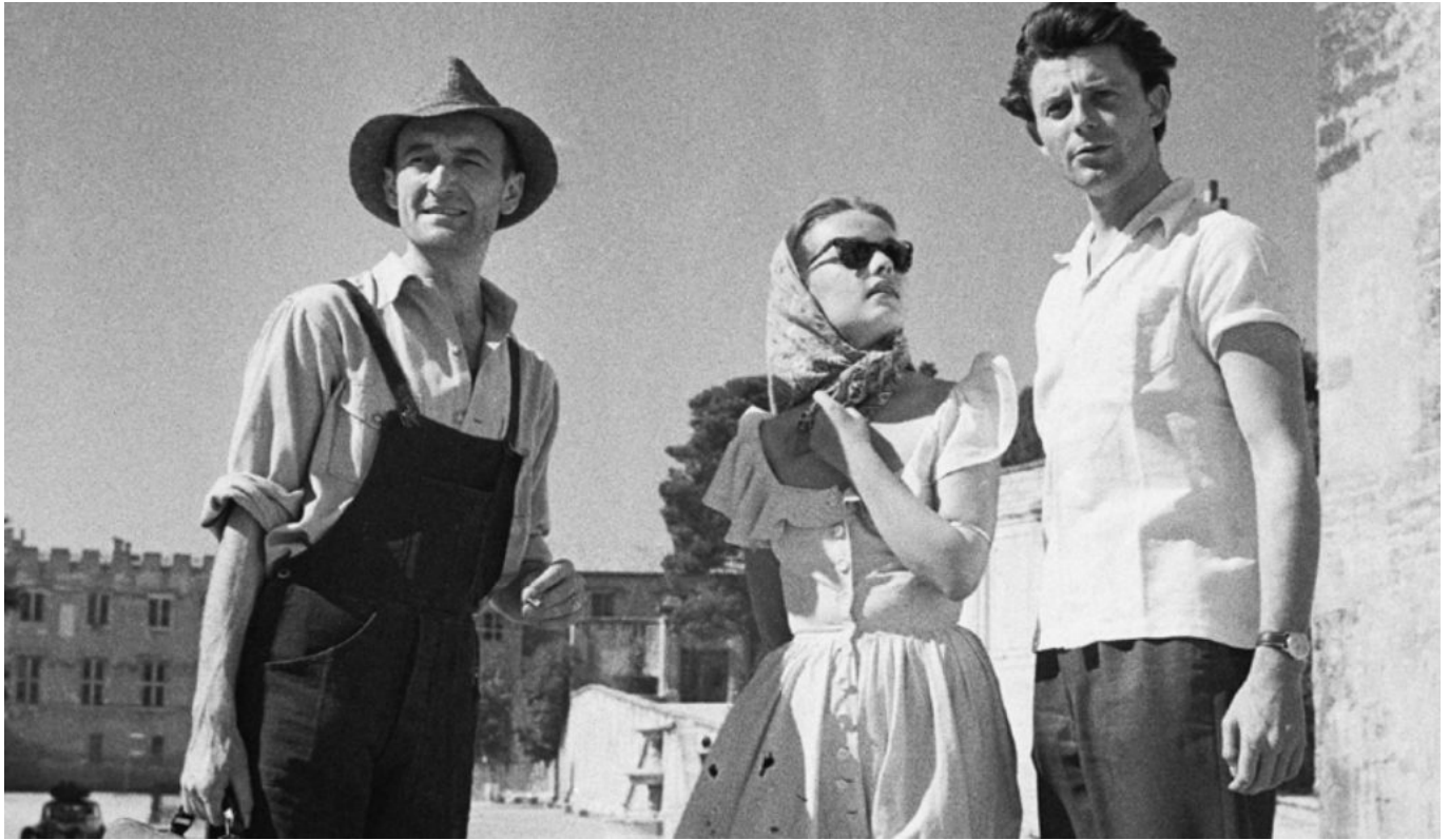
Jean Vilar, Jeanne Moreau et Gérard Philippe sur la place du Palais des Papes devant le Musée du Petit Palais