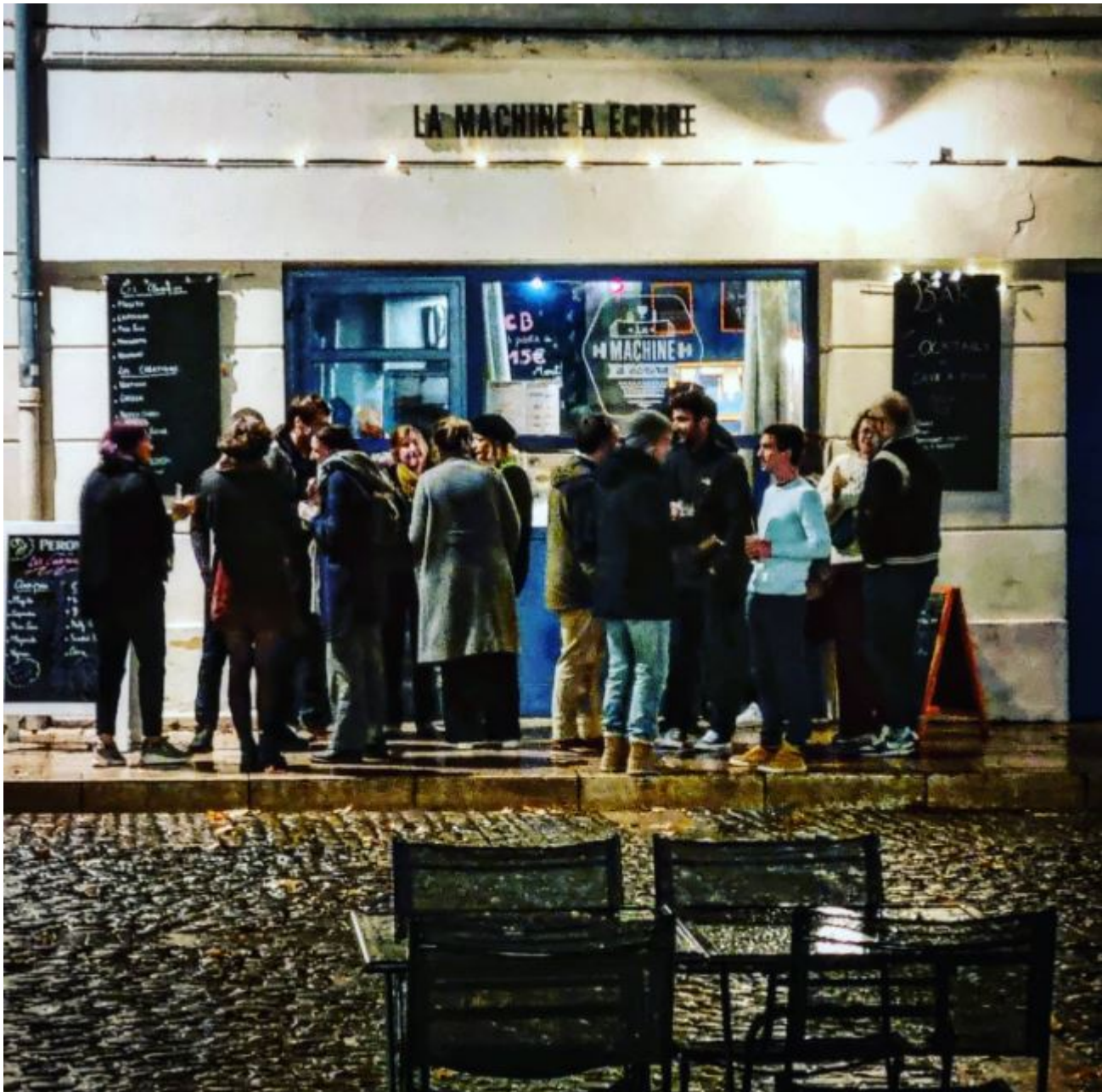
Carton plein à la Machine à écrire.