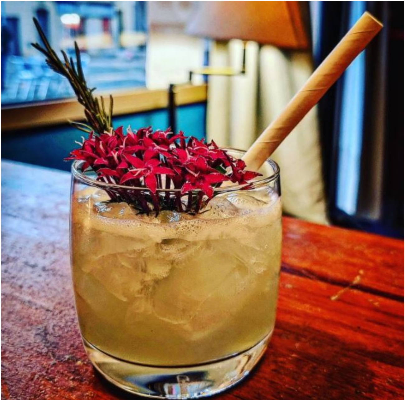
Les cocktails vous attendent 2 place des Carmes à Avignon.