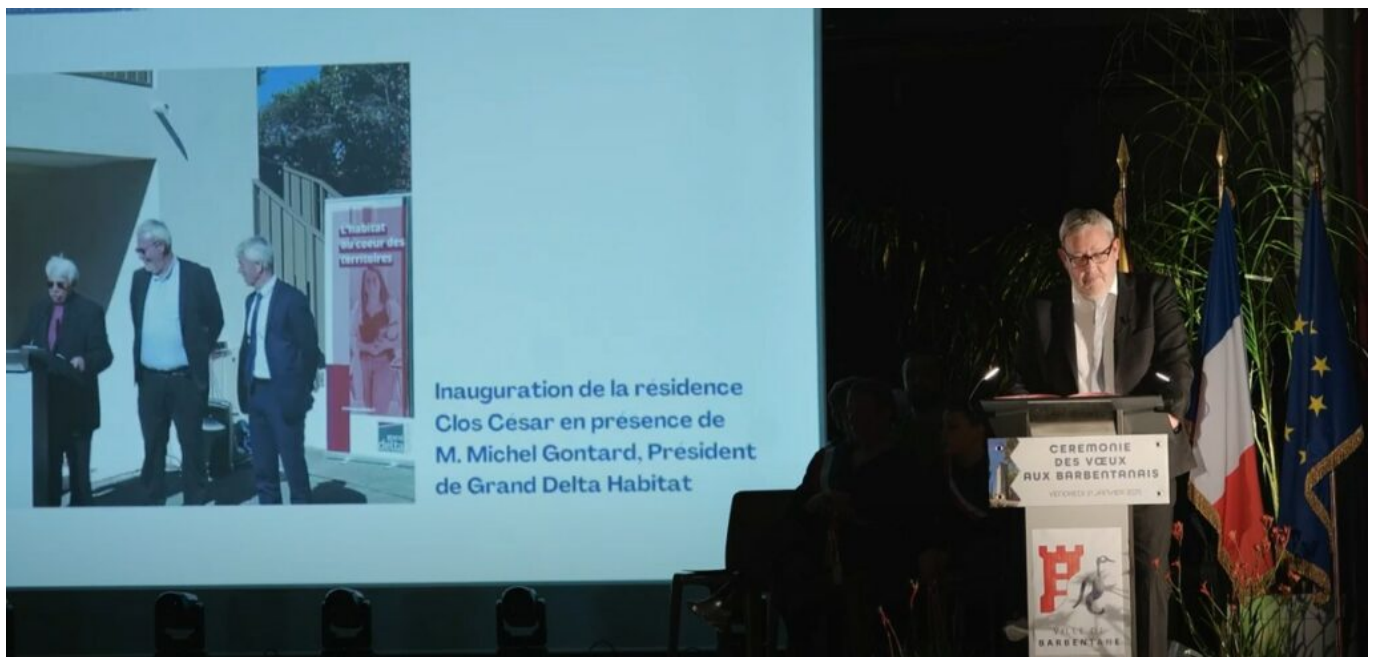
Inauguration du Clos César Résidence Grand Delta Habitat