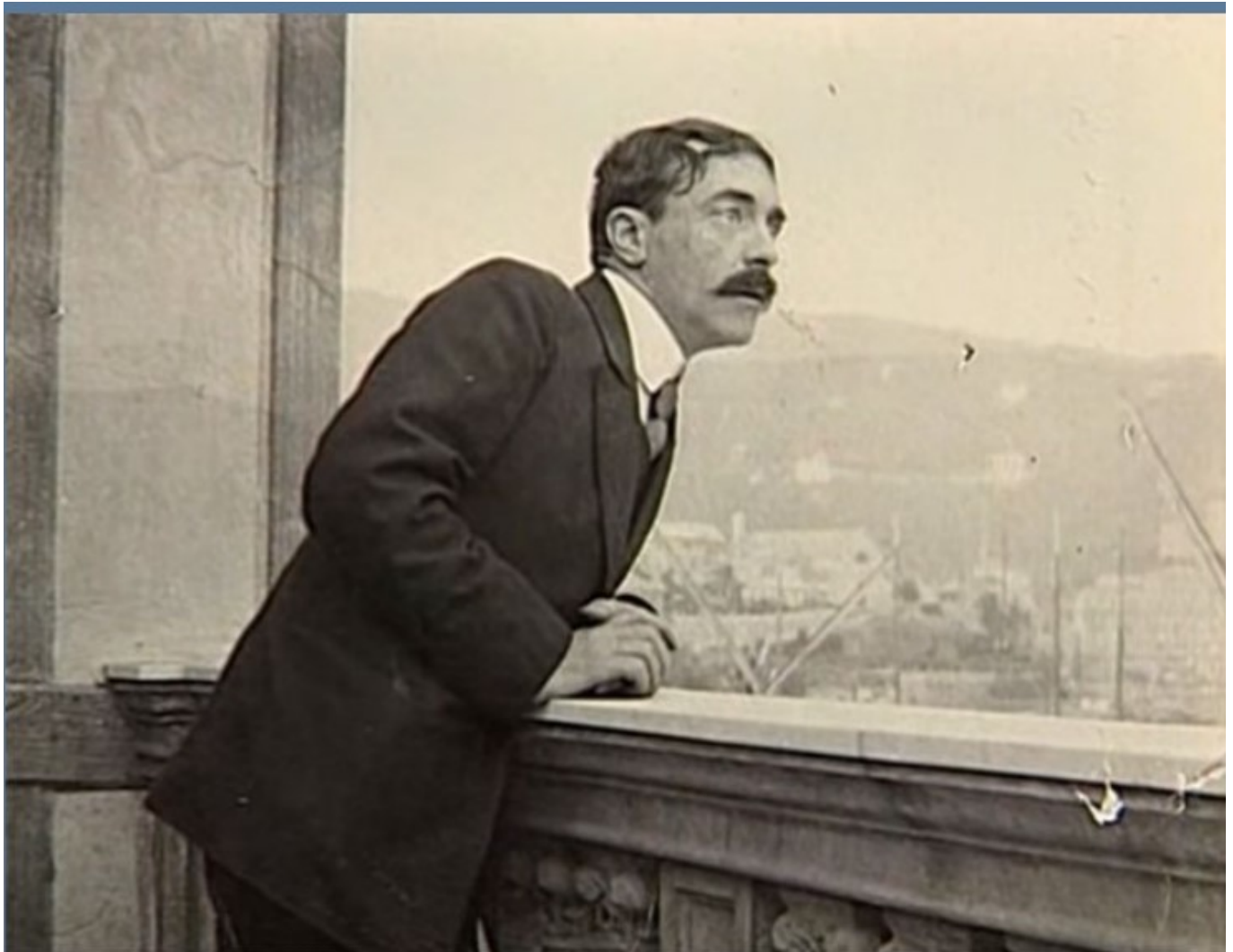
Paul Valéry