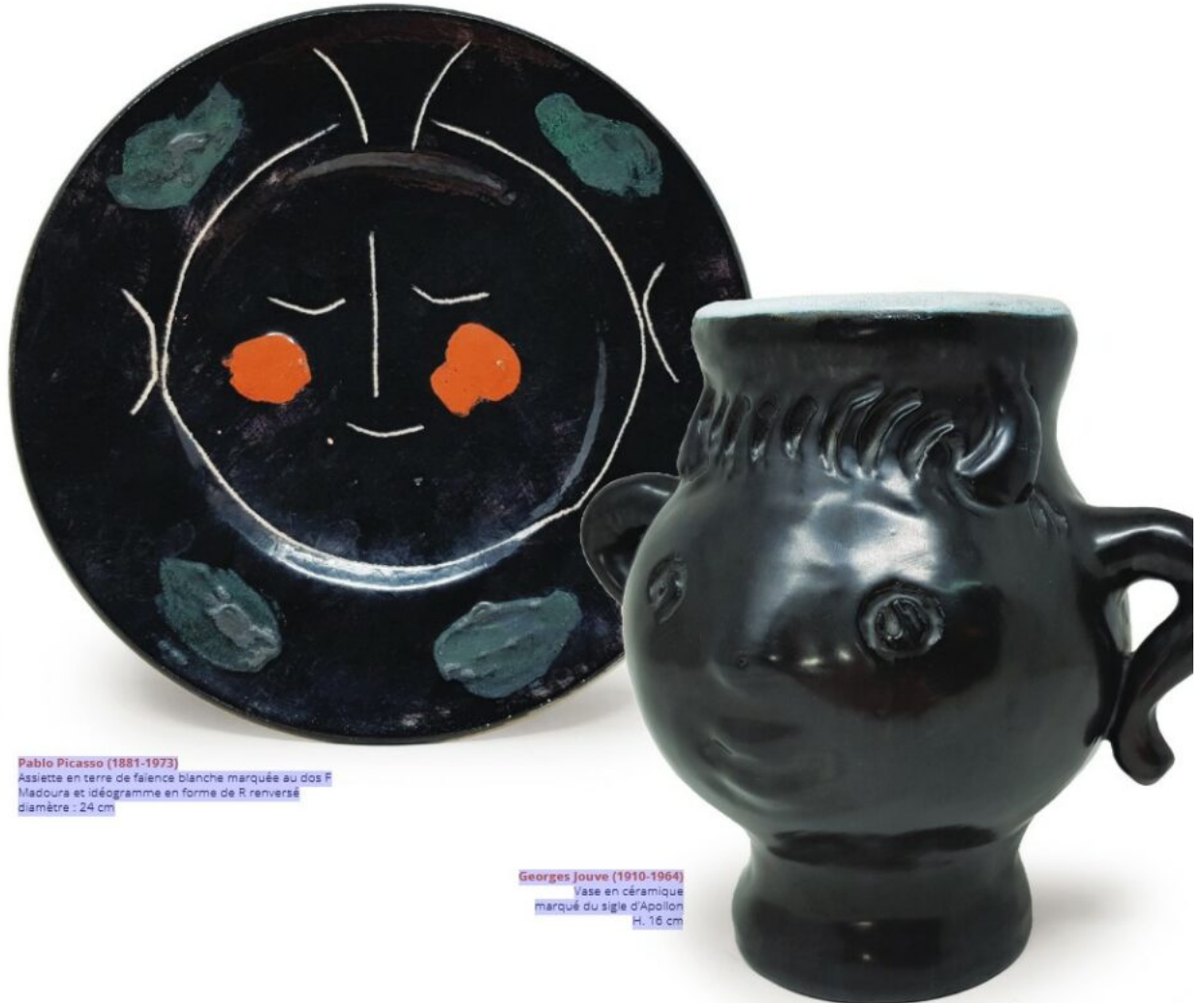
Pablo Picasso (1881-1973) Assiette en terre de faïence blanche marquée au dos F Madoura et idéogramme en forme de R renversé diamètre : 24 cm