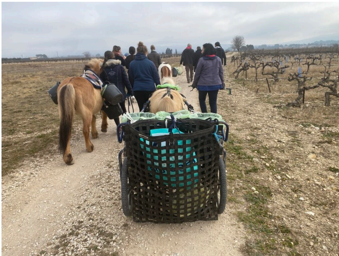
Le convoi de nettoyage mené par les poneys

Les trois jeunes âgés de 16 à 17 ans, encadrés par deux éducateurs de la PJJ ont ainsi nettoyé la nature pendant deux heures après avoir été informés des procédures de tri par deux agents de la Cove.