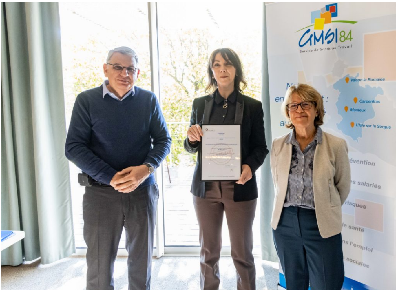
Remise du certificat.