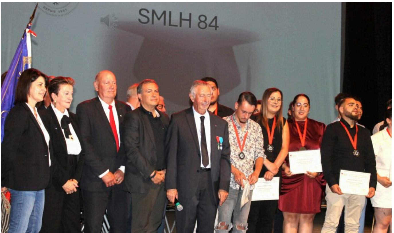
Les candidats primés et les membres de la SMLH84.

Pendant l'année scolaire, leurs professeurs ont détecté les élèves les plus méritants, ceux issus de milieux défavorisés, ceux qui avaient des problèmes de santé (autiste Aperger, handicapé, dyslexique) et proposé leurs noms aux membres de la SMLH 84. À leur tour, ils ont épluché le cursus de chacun, évalué son courage, sa pugnacité, sa détermination pour s'en sortir dans la vie professionnelle. En provenance d'une dizaine d'établissements (Centre Forestier de la Bastide des Jourdans, IFRIA - Métiers de l'agro-alimentaire - Nextech, CFA BTP Florentin-Mouret, Vincent-de-Paul, CCI Avignon Fenaisons, Campus Provence-Ventoux Louis Giraud, Conservatoire, Caserne des Pompiers).