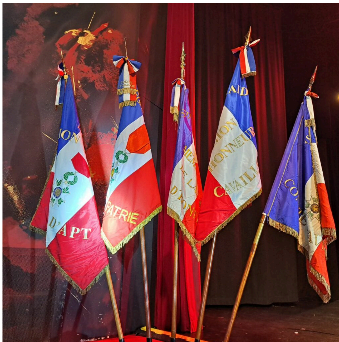
Les drapeaux des 5 comités de la SMLH 84.