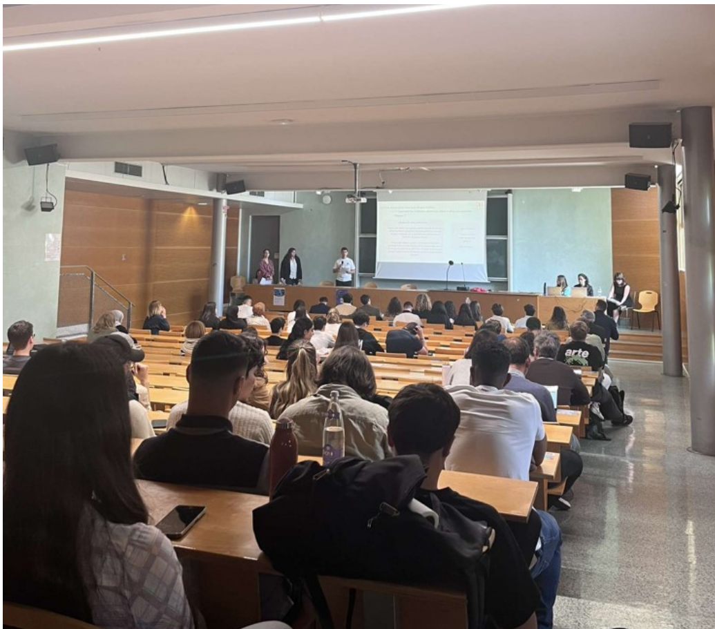
Durant la présentation de l'étude à l'université d'Avignon.

règlements de comptes et à l'insécurité « on a pu remarquer au cours de nos semaines d'observations que plusieurs évènements comme des barbecues étaient organisés, ouverts à tous, sans distinctions d'âge ou d'origine ethnique. On a pu également noter que plusieurs dispositifs étaient mis en place par les jeunes du quartier pour aider les mères de famille à porter les courses ou les emmener à certains endroits, ce sont des faits caractéristiques selon nous car c'est révélateur de l'ambiance générale et des règles caractéristiques, on est loin des clichés de violence véhiculés par les médias, il y a un réel élan de solidarité » assure Alexandre, un des étudiants ayant participé à l'étude.