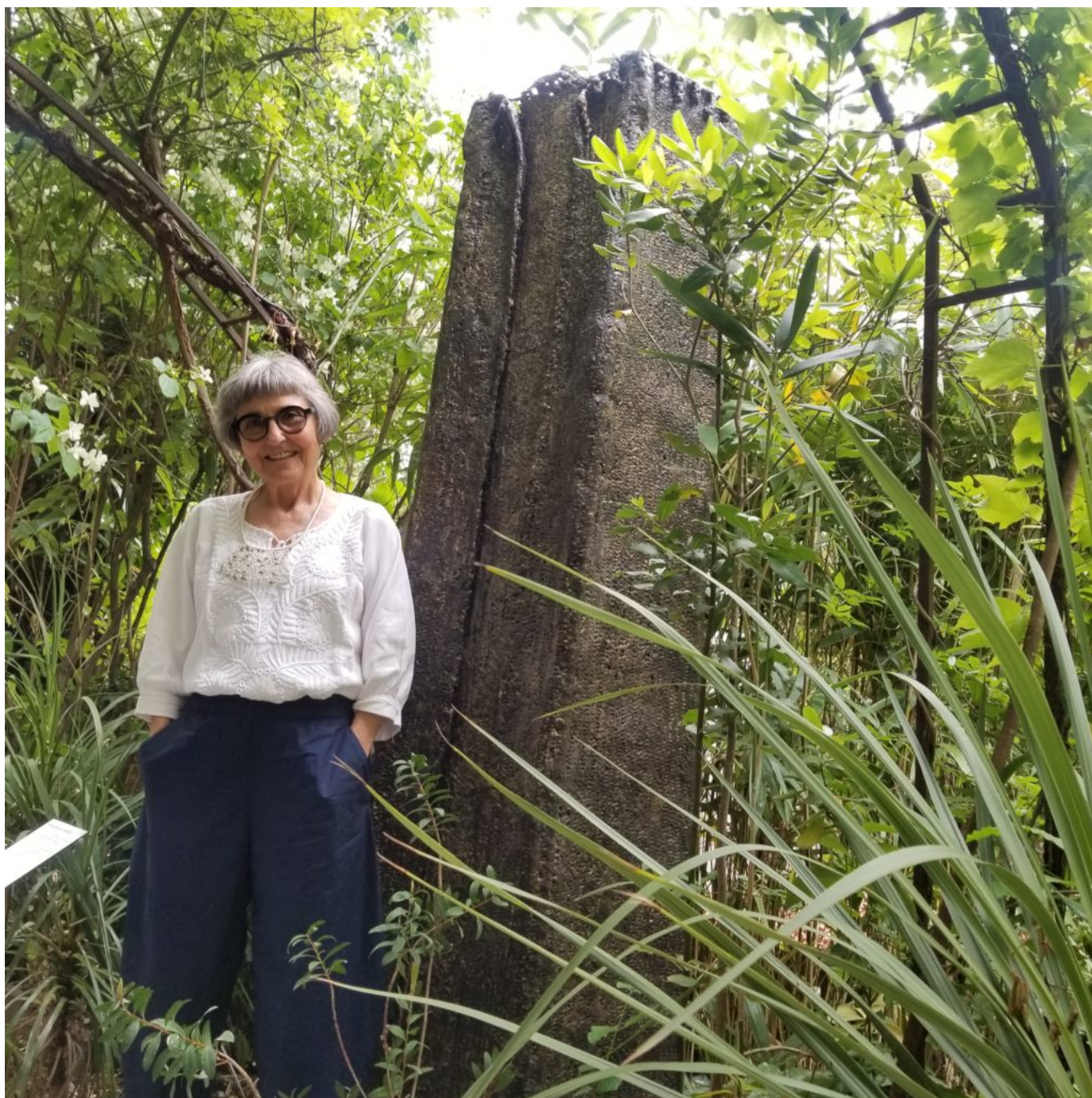
Odile de Frayssinet 'Comme une terre sans ombre'