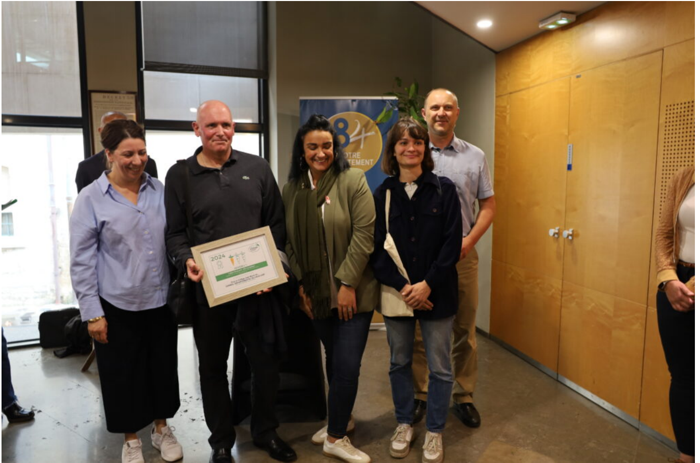
Collège Jean Bouin, Isle-sur-Sorgue