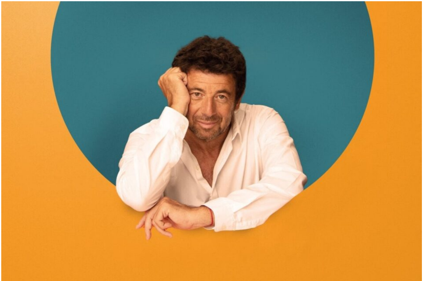
Patrick Bruel