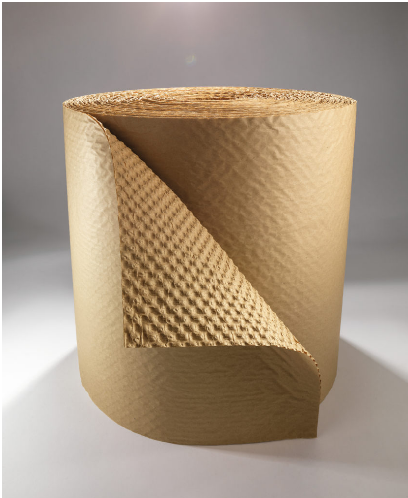
Papier bulle recyclé

Le papier bulle recyclé est une réelle innovation écologique qui permet de protéger les produits lors du transport et de l'expédition. Grâce à sa technologie exclusive, l'air est capturé entre deux couches de papier, ce qui confère à cet emballage d'excellentes propriétés d'absorption des chocs et d'amortissement. Léger, il permet de réduire les coûts de transports. Fabriqué en papier 100% recyclé et recyclable, facile à découper et à mettre en forme, le papier bulle est une alternative écologique au film bulle plastique. Le papier bulle a d'ailleurs reçu l'Oscar de l'Emballage 2021 pour son caractère innovant au bénéfice de l'environnement.