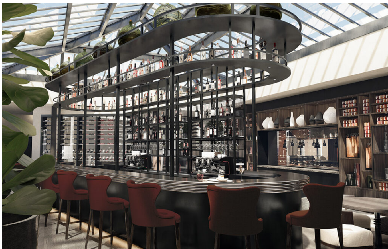
bar © Jean-Philippe Nuel/Axe 3D Studio