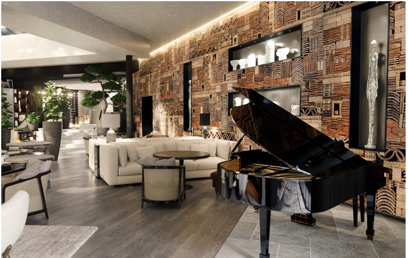
salon © Jean-Philippe Nuel/Axe 3D Studio