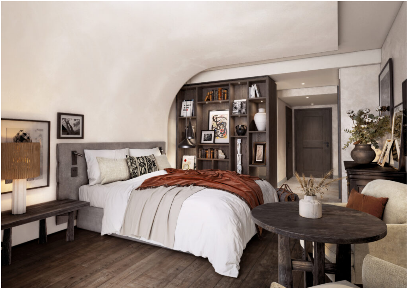
chambre coté lit © Jean-Philippe Nuel/Axe 3D Studio