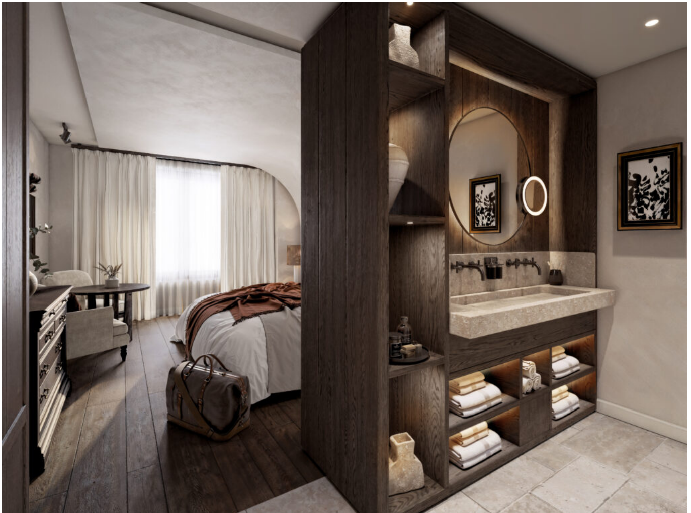
chambre coté salle de bain © Jean-Philippe Nuel/Axe 3D Studio