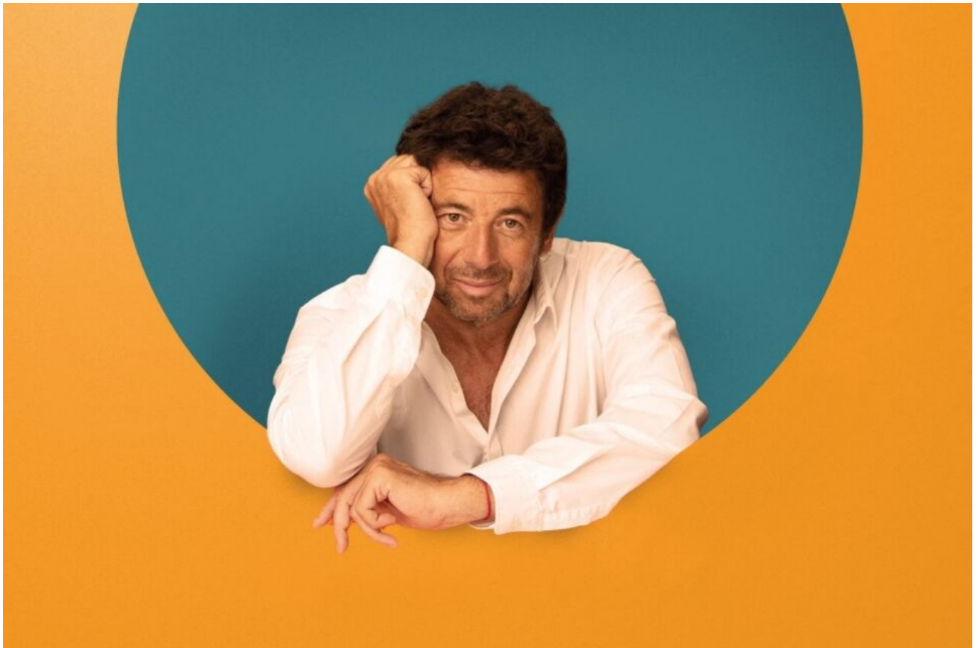
Patrick Bruel