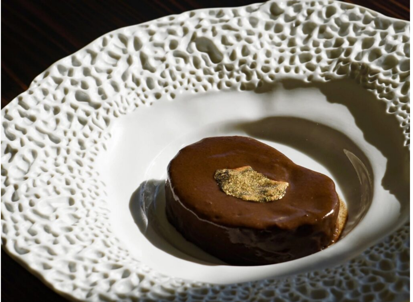
Lièvre à la royale.

à l'ail noir et en dessert une « Création amoureuse autour des agrumes et de chocolat. »