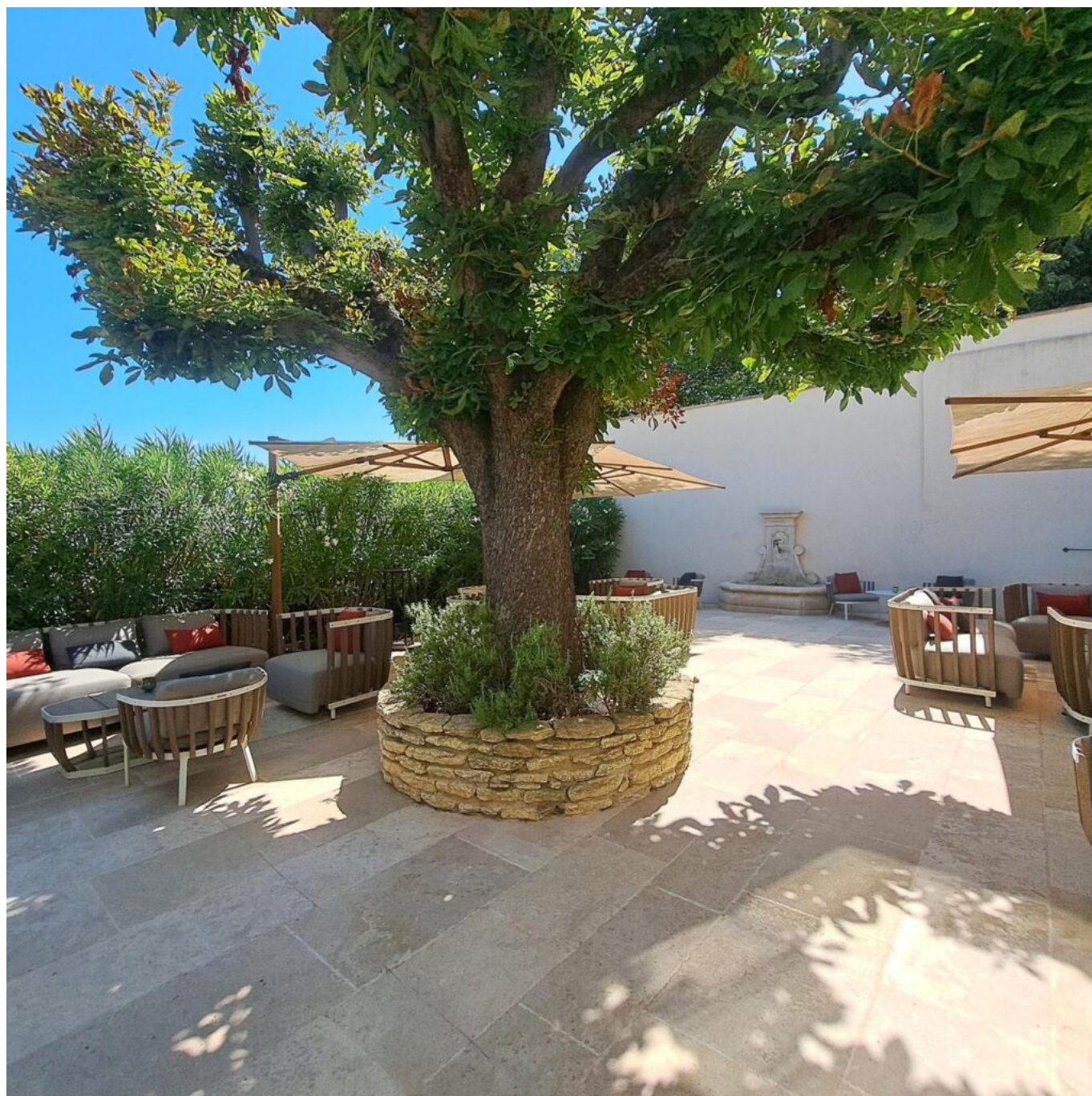
La terrasse de La Mère Germaine

À la carte, quand nous avons goûté son menu, ont défilé pas moins de huit propositions à se lécher les babines : Panisse moelleuse et croustillante au parfum d'aïoli, Tartelette de truite de l'Isle-sur-la-Sorgue