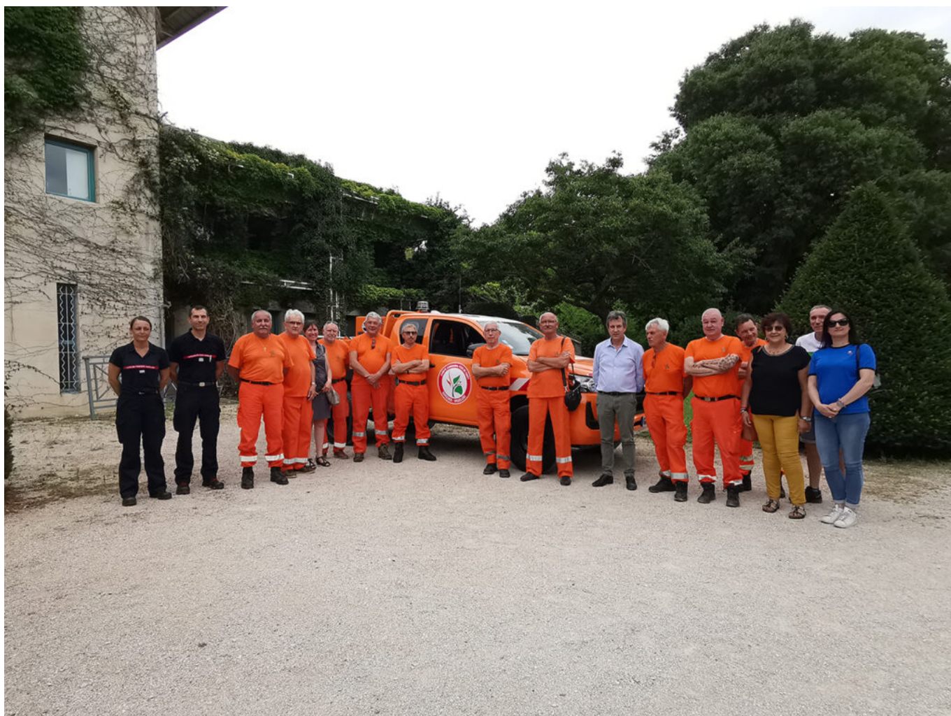
Véhicule CCFF