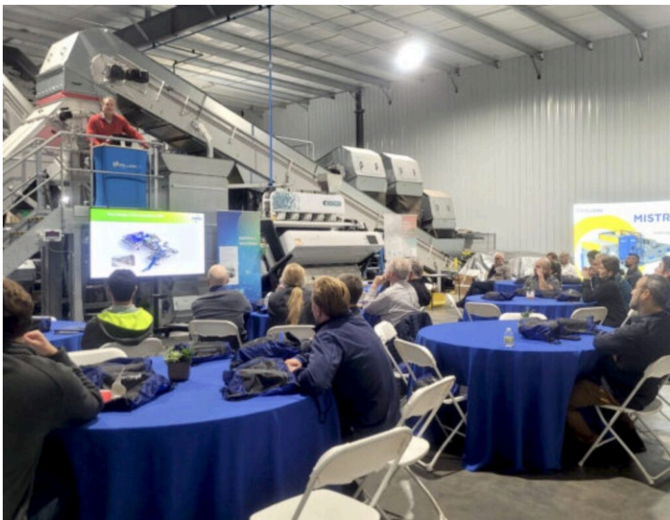
L'inauguration du nouveau centre de tests.

L'objectif de l'ouverture de ce nouveau centre et de se déployer à l'international afin d'apporter un service de proximité. En tout, l'entreprise détient 2 000 machines qui sont installées dans plus de 40 pays. « L'inauguration du centre de tests américain sera rapidement suivie par le déménagement et la modernisation de notre centre de tests japonais et par l'ouverture de nouveaux centres de tests en Australie et au Royaume-Uni d'ici 2024 », révèle Jean Henin , président de Pellenc ST.