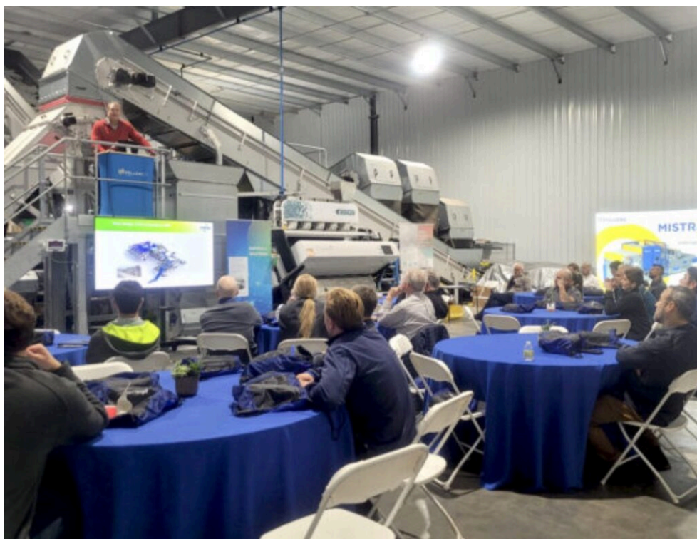
L'inauguration du nouveau centre de tests.