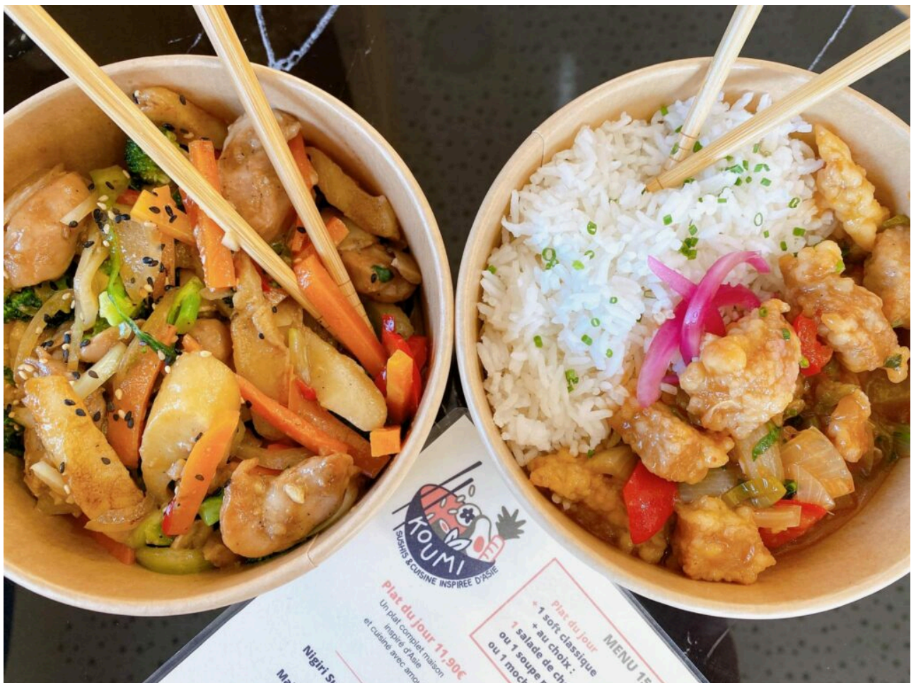
Koumi propose des plateaux de sushis, des brochettes, ou encore des bo buns.