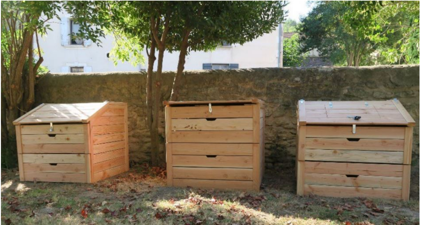
Site de compostage partagé salle des fêtes