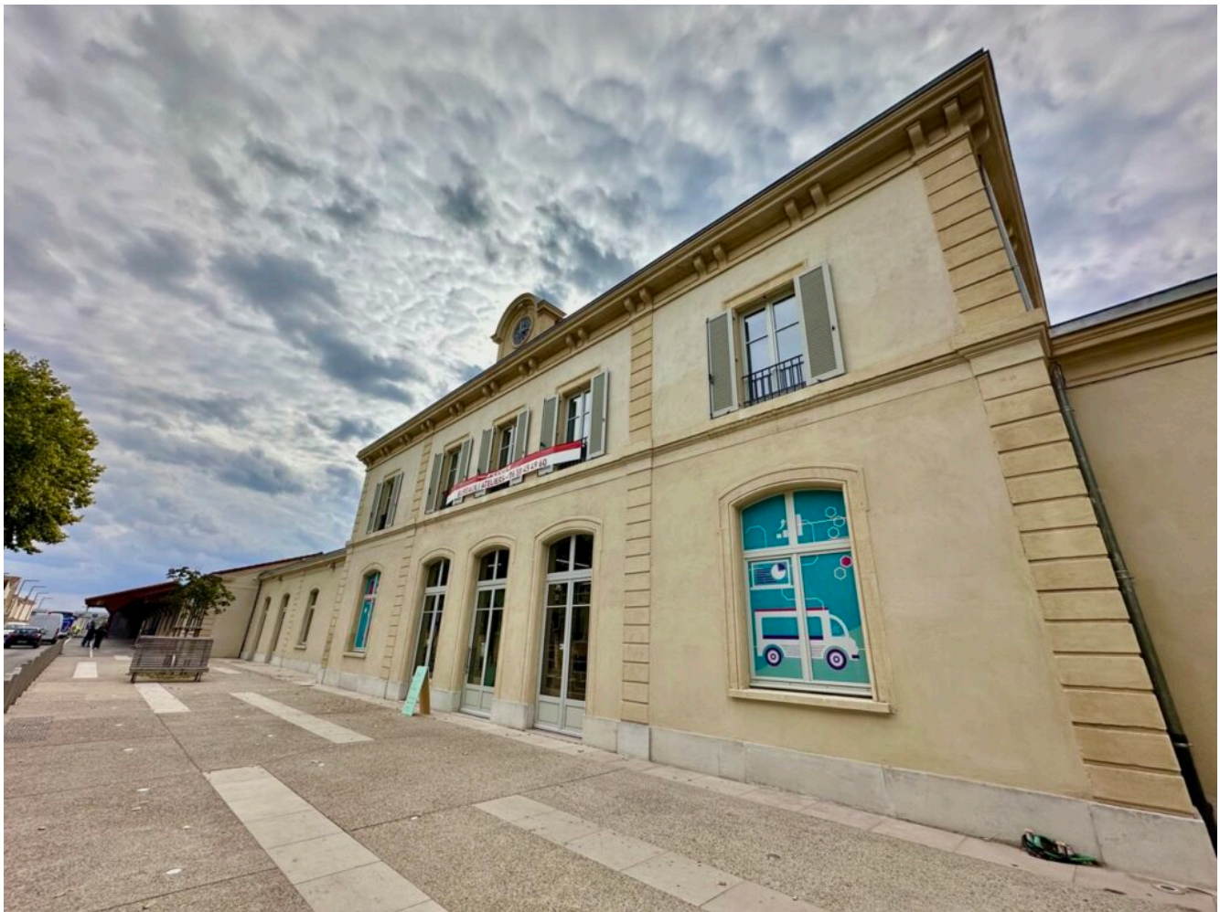
La Gare numérique, vue du côté de l'Avenue de la gare.