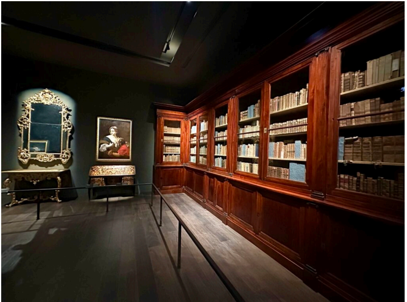
La bibliothèque de Barjavel