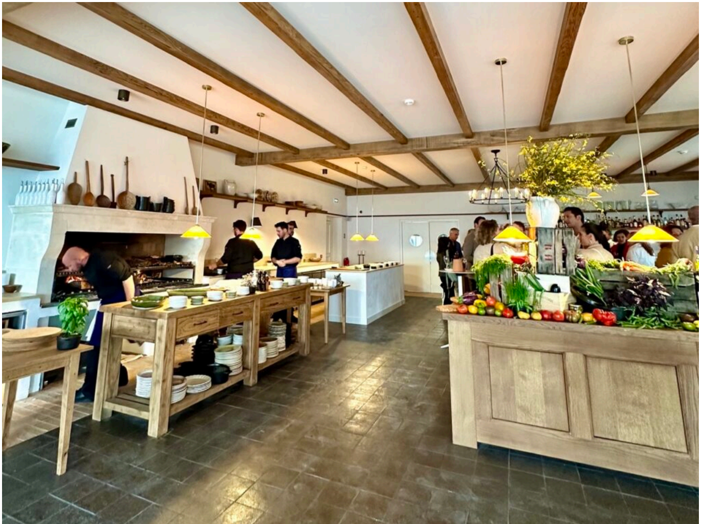
La Bergerie.