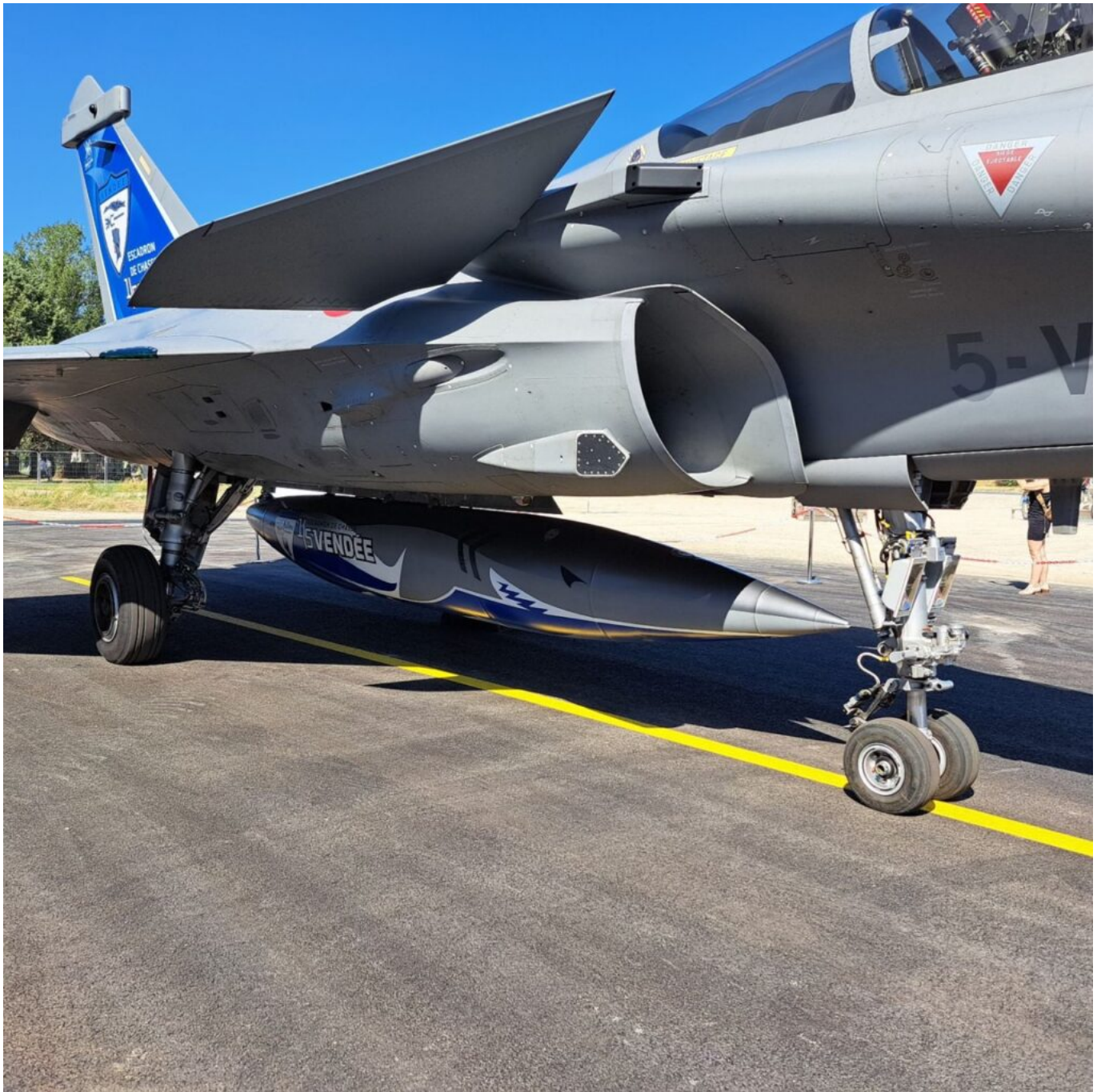
L'armement du Rafale.