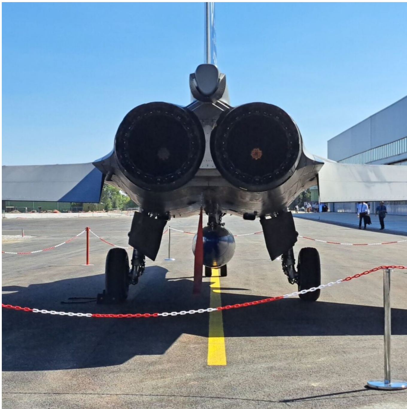
Les réacteurs du Rafale.

Mont-de-Marsan à être équipé de Rafale avec pour triple mission : la posture 24h/24 de l'espace aérien français, l'aide aux aéronefs en difficulté et l'interception face aux intrusions malveillantes. Un aéronef qui vole à Mach 1,8 (2223 km/h) et a une autonomie de 3 700 km.