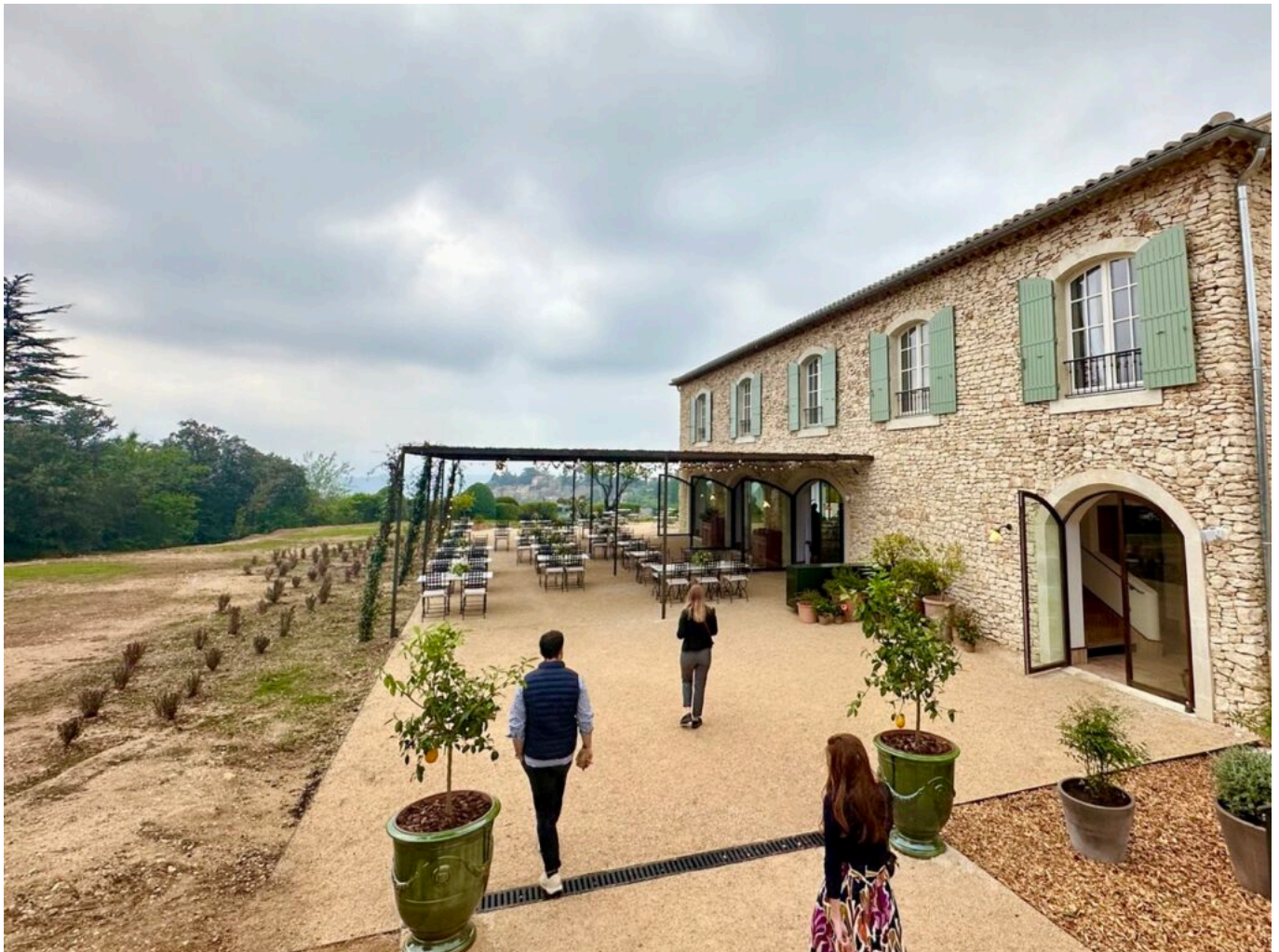
La nouvelle Bergerie.