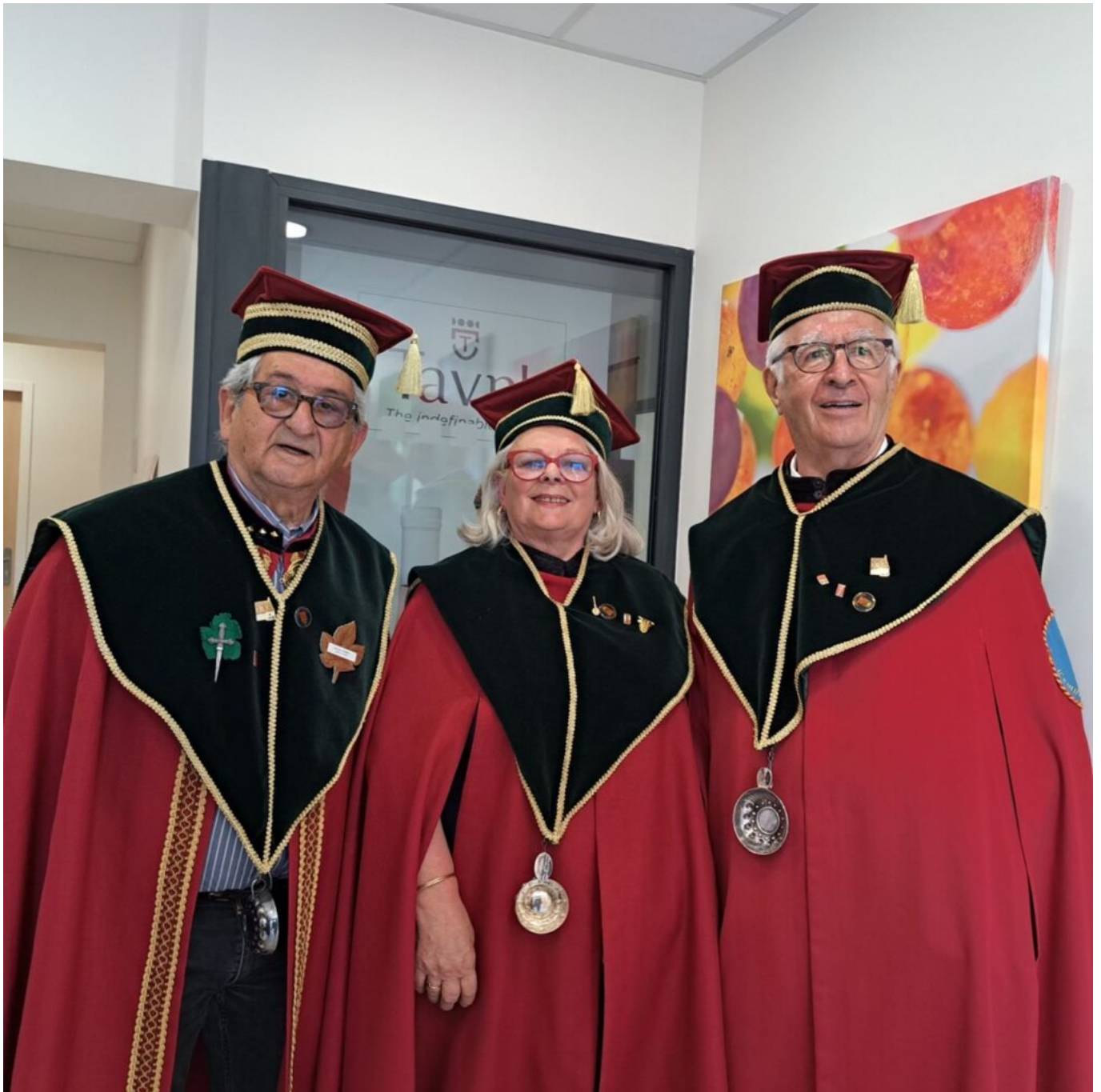
La Commanderie de Tavel.

Contact : 04 66 50 32 34. 56 Chemin de la Croix d'Alix, Tavel