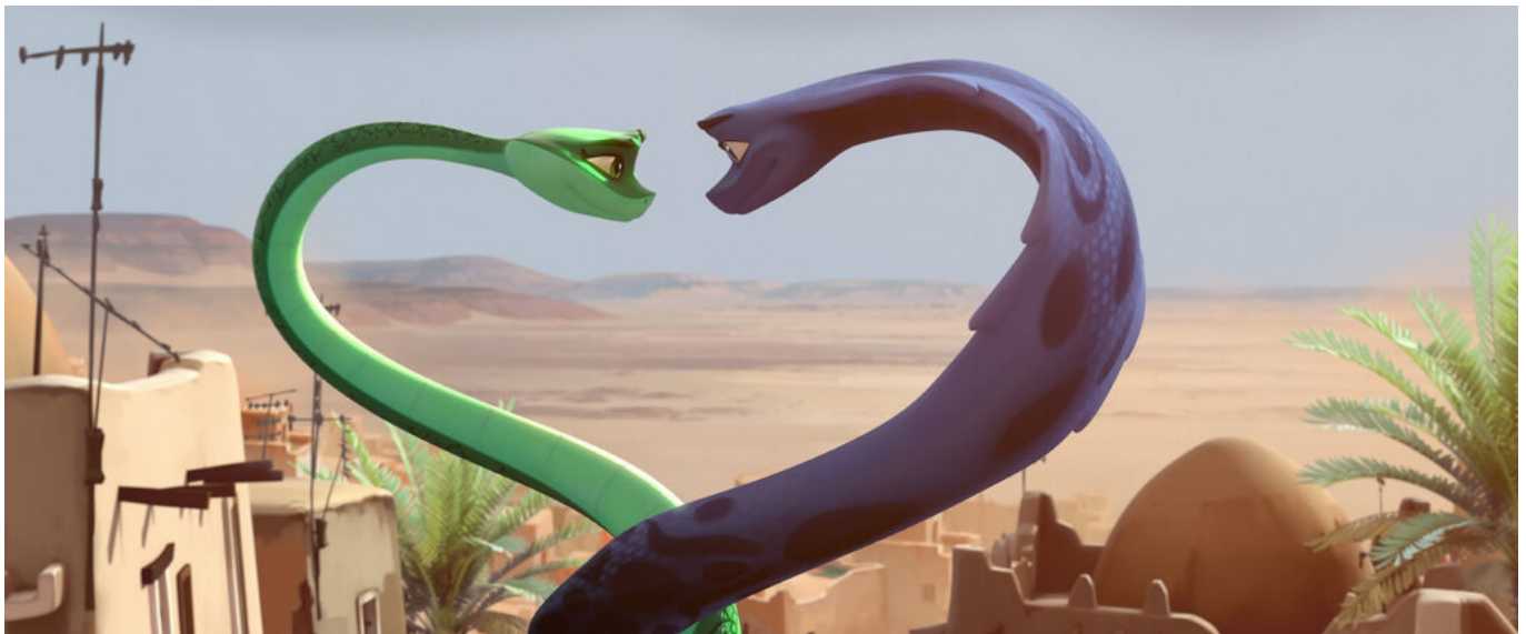
Le long métrage d'animation Sahara est sorti en 2017.