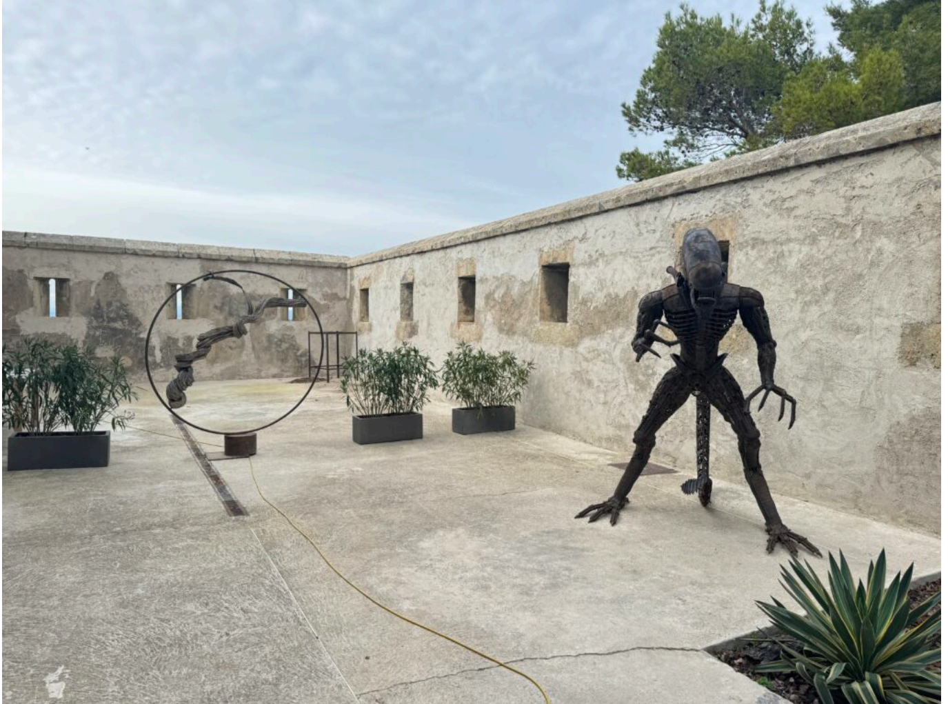
L'art, nouveau gardien des lieux

accueillant des musiciens et projetant des tableaux dans l'atrium. Des vernissages fréquents ainsi que des expositions de tableaux ont également eu lieu. Enfin, le site s'inscrit dans l'aménagement d'une nouvelle promenade touristique reliant les écluses de Fonsérannes et la Cathédrale de Béziers.